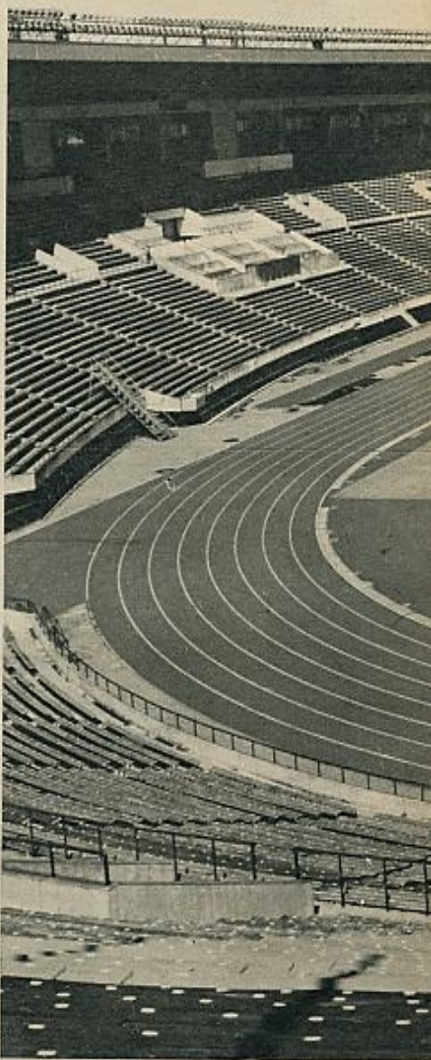
Una amplia panorámica del Estadio Nacional, donde

construcción que alcanza una dimensión de 430.000 metros cuadrados, aparte de las instalaciones auxiliares, que ocupan otros ciento veinte mil metros cuadrados.