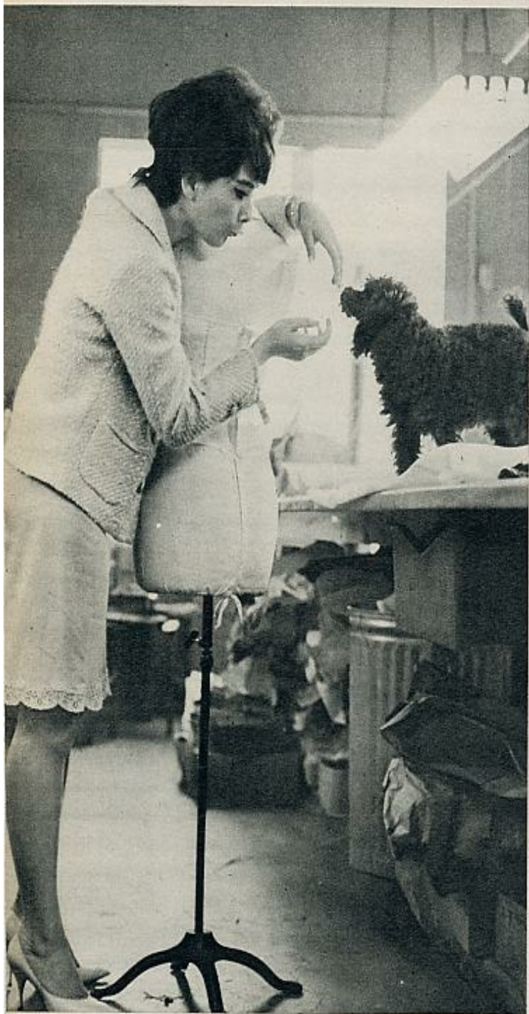
Los pocos ratos que su trabajo —que cada día es más intensivo— le deja libres, los emplea Suzanne Pleshette en olvidarse del estudio y estar con su marido.

viaje —siquiera corto— de luna de miel, se casaron el pasado mes de enero. Y aunque han empezado a correr rumores sobre su posible separación, hasta ahora lo único cierto es que, rodeados de amigos —jóvenes actores y escritores de cine—, pasan los momentos que sus obligaciones profesionales les dejan libres en amor y compañía. Suzanne, que obtuvo su mayor éxito en el teatro interpretando el papel de Ana Sullivan en la obra de Gibson, que en nuestros escenarios hiciera varias veces centenaria Lola Cardona, parece dispuesta a alcanzar el estrellato cueste lo que cueste. De su mente se han borrado ya los recuerdos de aquella su primera