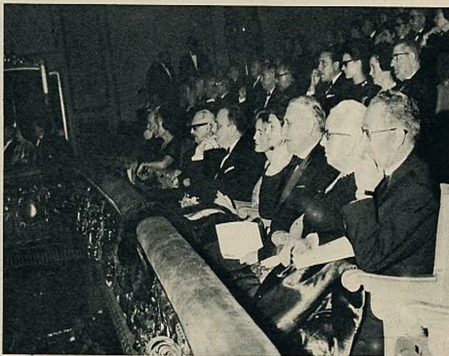
Los ministros del Gobierno, el presidente de las Cortes, el Cuerpo Diplomático y otras numerosas personalidades asistieron al estreno oficial en Madrid de la película que relata la vida del Jefe del Estado español.