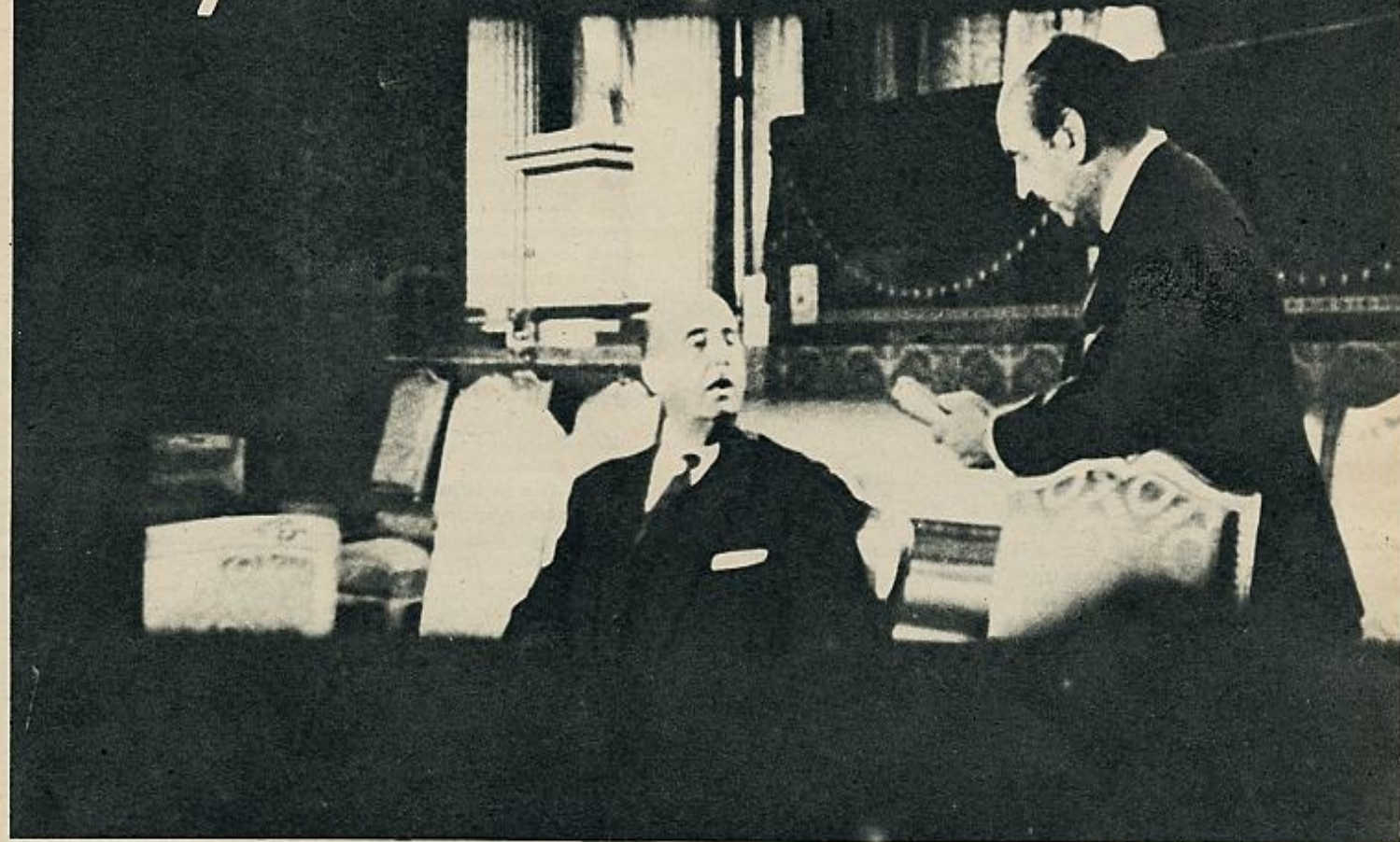
Los últimos planos de «Franco, ese hombre» muestran al Jefe del Estado tras haber presenciado la película de su vida en la salita de proyección del Palacio de El Pardo.

paso por la Academia Militar, las distintas etapas de su estancia en Marruecos, con los Regulares, en la Legión. Sus heridas gravísimas, de las que sale adelante. Luego, los años anteriores a la guerra civil, los tres años de lucha sintetizados en los acontecimientos más sobresalientes de esa etapa crucial de la vida española. La posguerra y el pasado cercano, con pinceladas de su quehacer íntimo. A lo largo del film, vemos las figuras históricas y los hechos culminantes del período cronológico del que ha sido protagonista de excepción Francisco Franco.