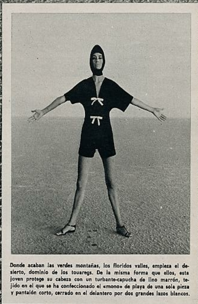
Donde acaban las verdes montañas, los floridos valles, empieza el desierto, dominio de los touaregs. De la misma forma que ellos, esta joven protege su cabeza con un turbante-capucha de lino marrón, tejido en el que se ha confeccionado el «mono» de playa de una sola pieza y pantalón corto, cerrado en el delantero por dos grandes lazos blancos.