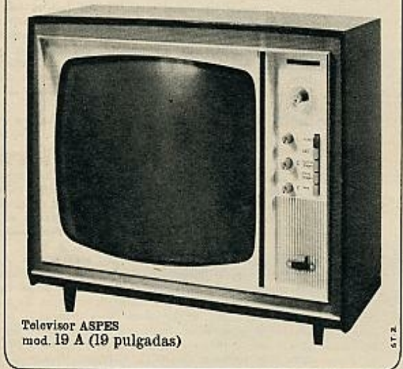
Televisor ASPES mod. 19 A (19 pulgadas)

La pantalla es negra. Un televisor de pantalla negra significa para su dueño descanso visual completo... Esta, además, concebido para obtener siempre una imagen regularmente luminosa. En el teclado de mandos, indica UHF. Y en el interior hay un espacio y conexiones a punto para incorporar inmediatamente el sintonizador UHF (Ultra High Frequency).