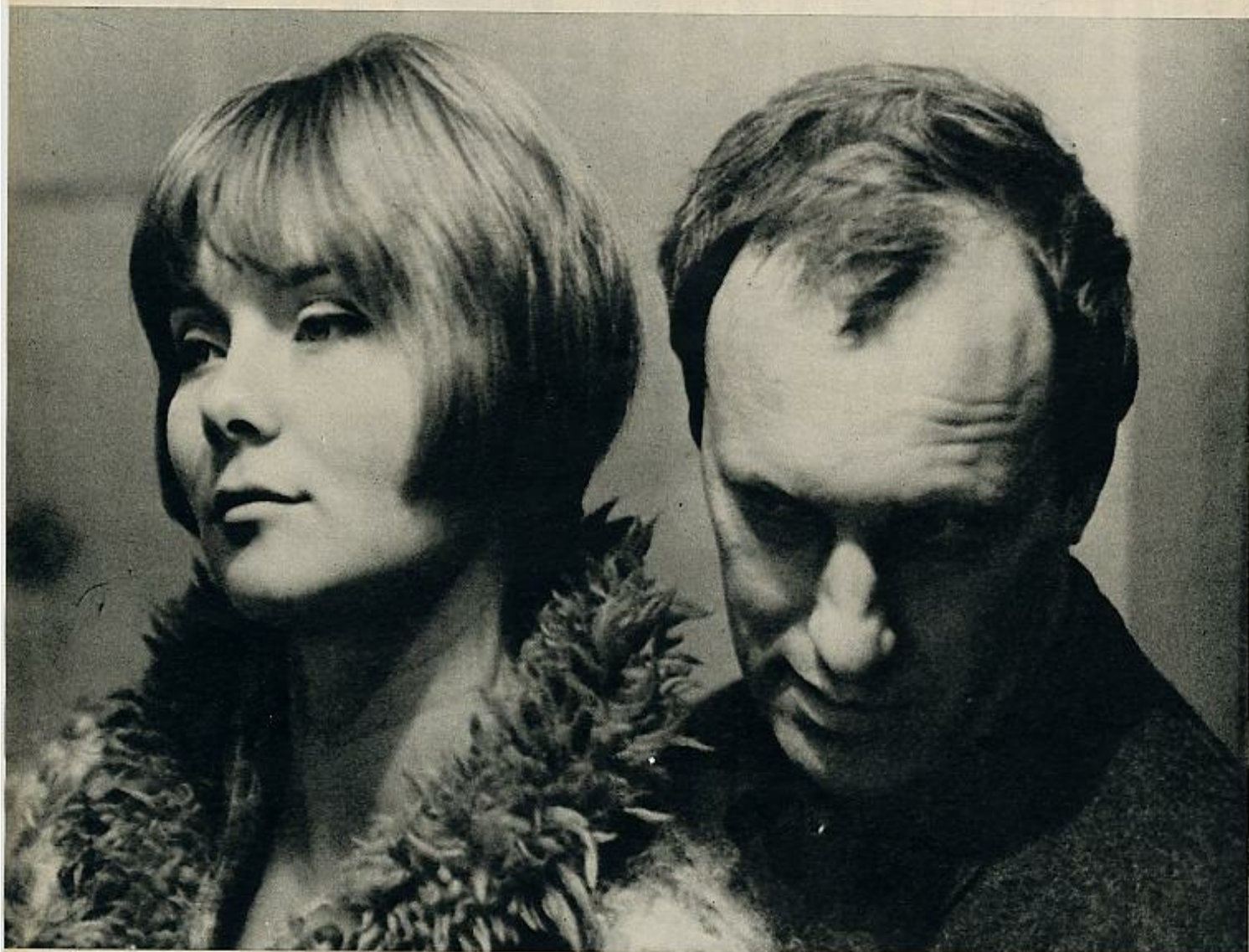
Macha lleva una vida tranquila y sale poco, a no ser para cuestiones relacionadas con su trabajo o para hacer una visita a casa de su modista, Louis Feraud.

no quiere convertirse en un personaje estereotipado, repetirse de película en película. Incluso ha declarado que si ése ha de ser el precio del éxito lo considera demasiado fuerte para pagarlo. Prefiere estudiar detenidamente las proposiciones que le han llovido después de su revelación y, si ninguna le interesa lo suficiente, hacer teatro, cosa que cree imprescindible para convertirse en una verdadera actriz. Y, aunque no ha tenido inconveniente en interpretar, en el film de Godard, escenas bastante osadas que provocaron un escándalo y estuvieron a punto de provocar la prohibición de la película, se niega a enseñar las piernas para hacerse notar. Su oficio pasa ante todo, y en función de él es capaz de hacer cualquier cosa, pero detesta todo el tinguado marginal que muchas veces se confunde con el ejercicio de la profesión.