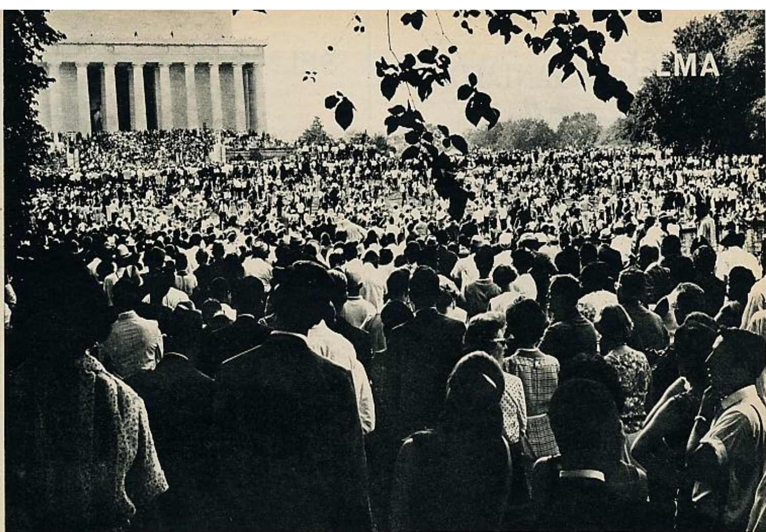
«Imaginad lo que sería el mundo todo Sur...», ha gritado el poeta. Para que no lo sea se manifestaron en Washington, ante el monumento al «Emancipador», centenares de miles de personas. El movimiento negro, que es una lucha social más que racial, amenaza con conmovir toda la estructura norteamericana.