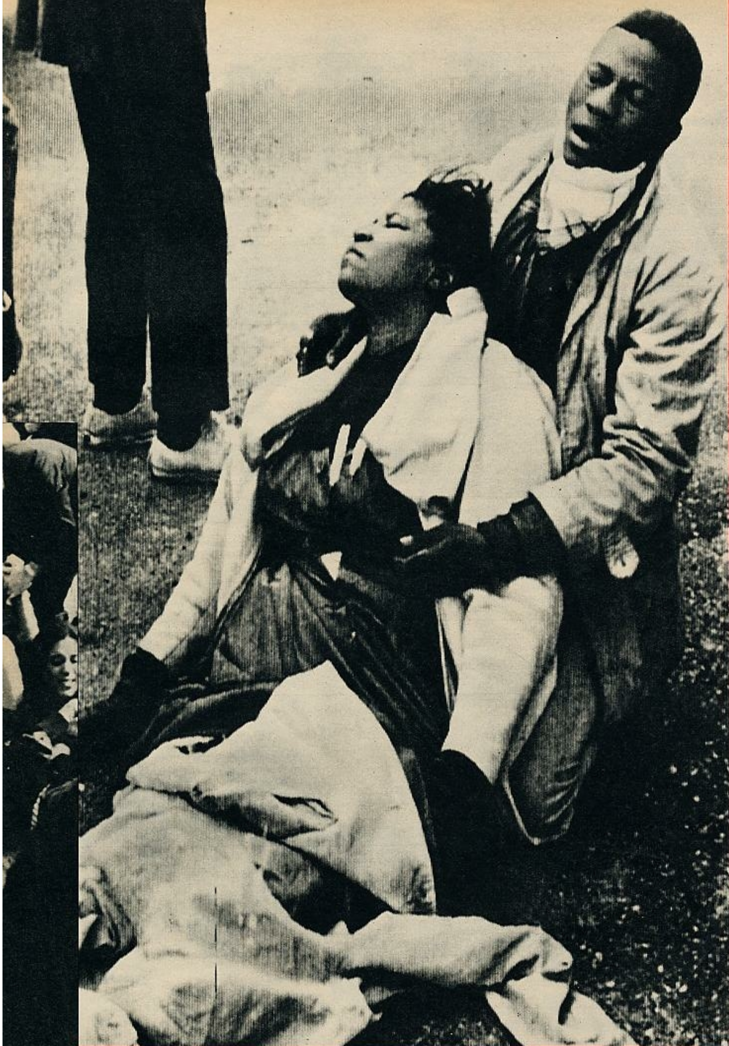
Al otro lado de la línea racial está Wallace, con su Policía. La represión es brutal, sangrienta. Johnson y Wallace se entrevistan luego en Washington. Johnson habla de la «dignidad humana», de la «justicia», de la «Constitución». Los negros continúan decididos su lucha. SIGUE