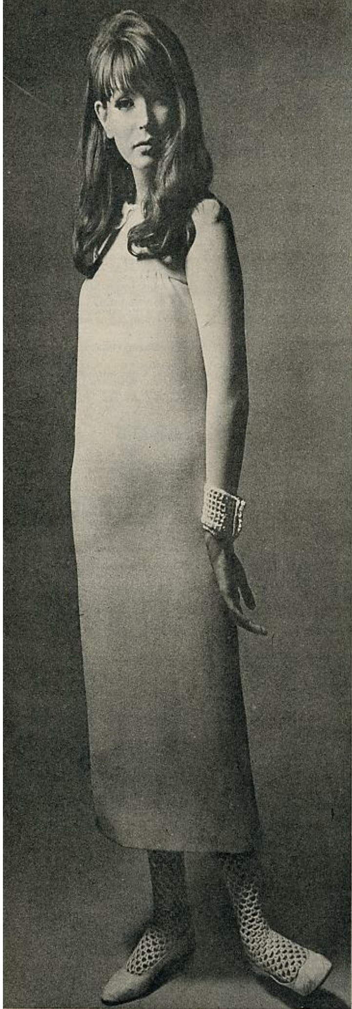
Esto que parece un camisón de niña juiciosa es una de las creaciones de Mary Quant, sorprendente a fuerza de simplicidad. Es de «crêpe» amarillo.