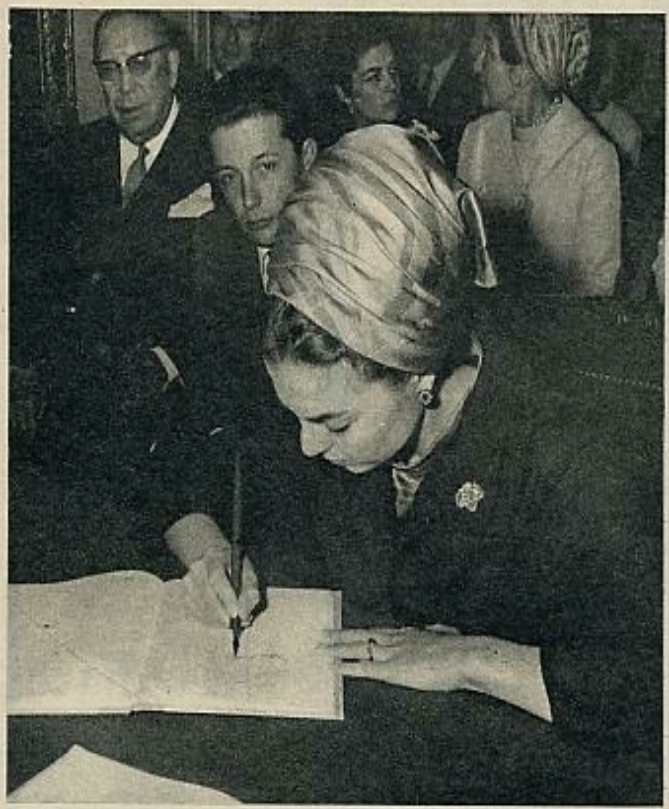
A la boda de la princesa Ana de Francia asistieron representantes de todas las familia reales de Europa. Entre ellos se encontraba el príncipe don Juan Carlos de Borbón (arriba). El día anterior se había celebrado el matrimonio civil. Abajo, la princesa Ana de Francia en el momento de firmar el acta.