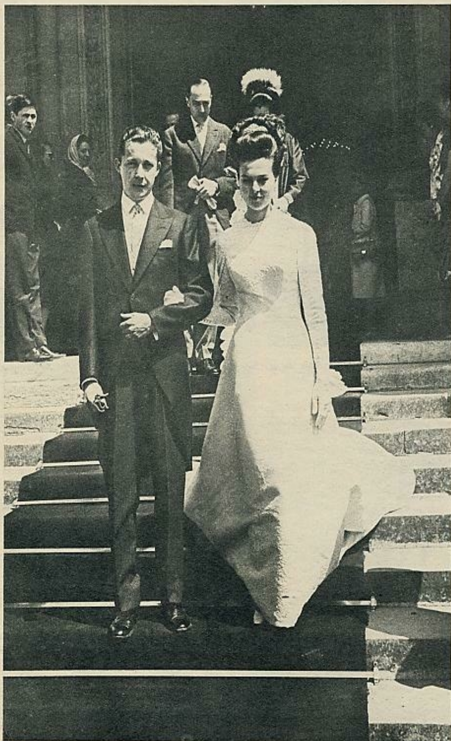
Ana de Francia con su esposo, Carlos de Borbón-Dos Sicilias, saliendo de la Capilla Real de Dreux.