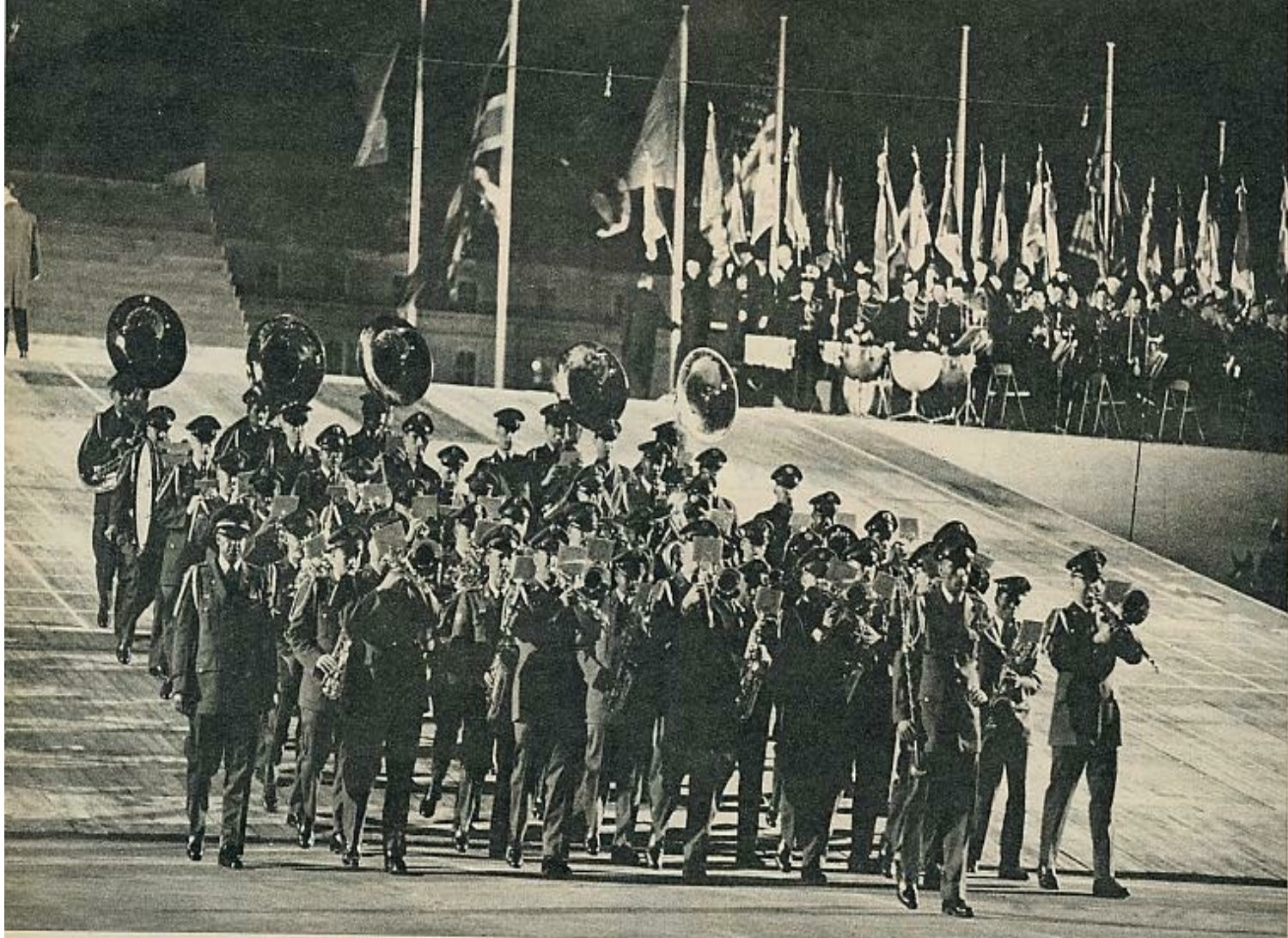
Ni en Londres ni en Washington se celebró el vigésimo aniversario de la derrota alemana para no ofender a los dirigentes de la República Federal. No obstante, en París desfilaron una banda de música del ejército norteamericano y los «Scotisch pipers». La grandiosa ceremonia tuvo lugar ante los Inválidos.