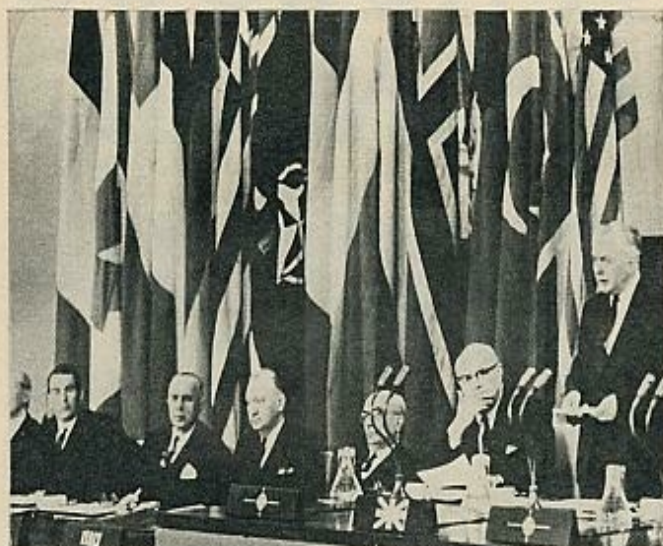
Wilson, jefe del Gobierno británico, expone sus quejas antidegaullistas ante el consejo ministerial de la NATO, celebrado en Londres la semana pasada.