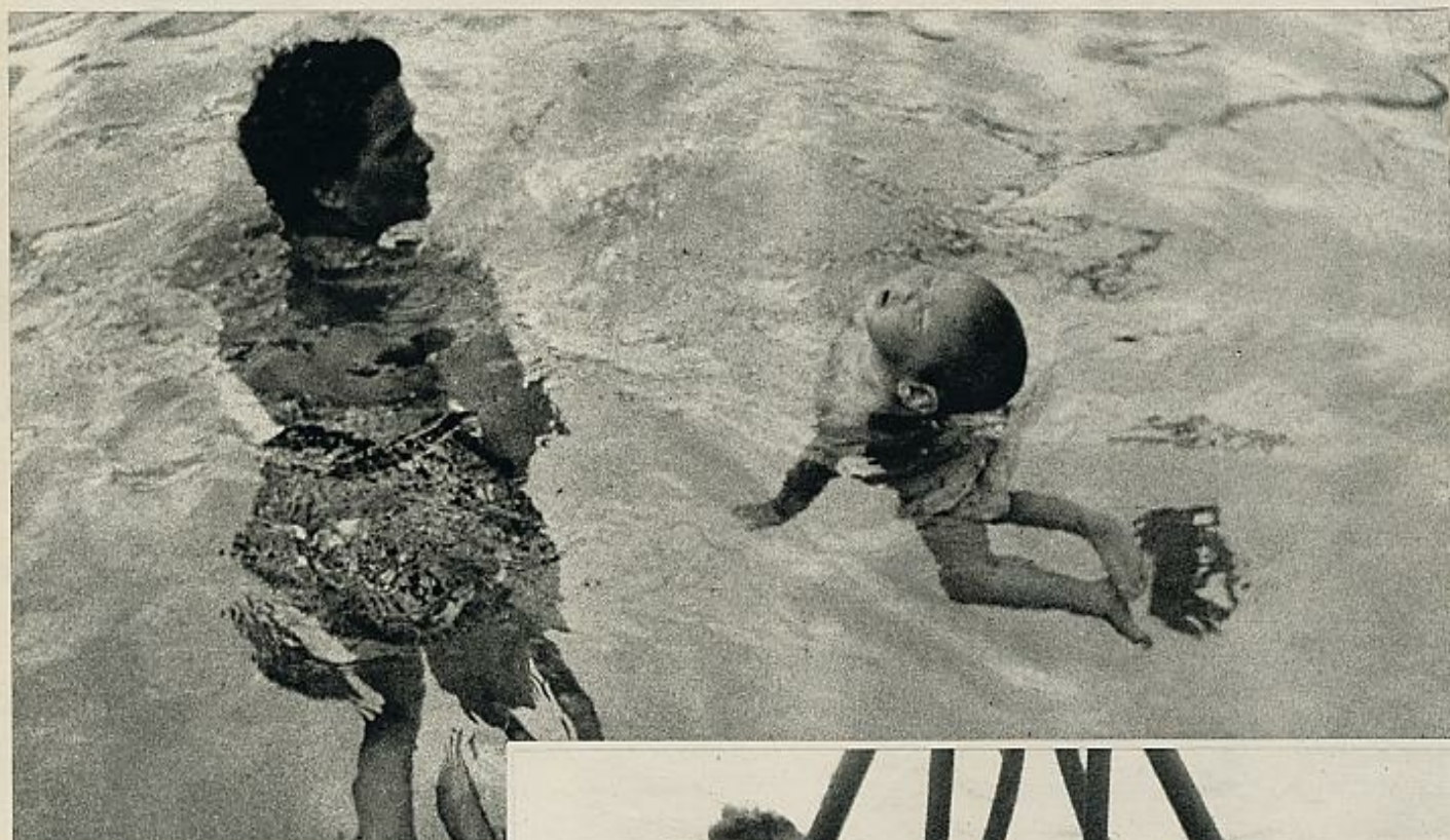
Los niños de Los Angeles juegan en el parque más extraño del mundo: está situado a dos metros de profundidad, en la piscina de Jean Loven.

E L agua es divertida... siempre que esté templada y no se le tenga miedo. Sobre todo, es divertida para los niños de Los Angeles, que disfrutan de un insólito parque infantil, sin duda el más extraño del mundo: está situado bajo el agua.