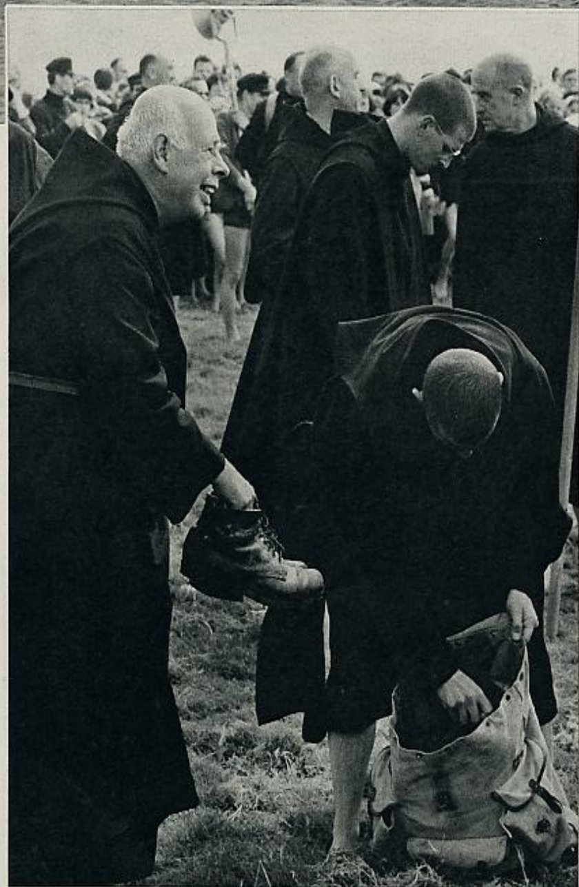
Con los hábitos arremangados, los benedictinos emprenden la

C ONSIDERADO por los franceses la «octava maravilla del mundo», el Mont Saint-Michel emerge del agua, como un barco. El prodigio se repite diariamente cuando la marea sube y el Mont parece navegar mansamente sobre la superficie marítima. La célebre abadía de Saint-Michel ha sido escenario de una magna concentración en la primera decena del mes de septiembre. De toda Normandía se han desplazado peregrinos para asistir a los actos de celebración del milenario de su fundación.