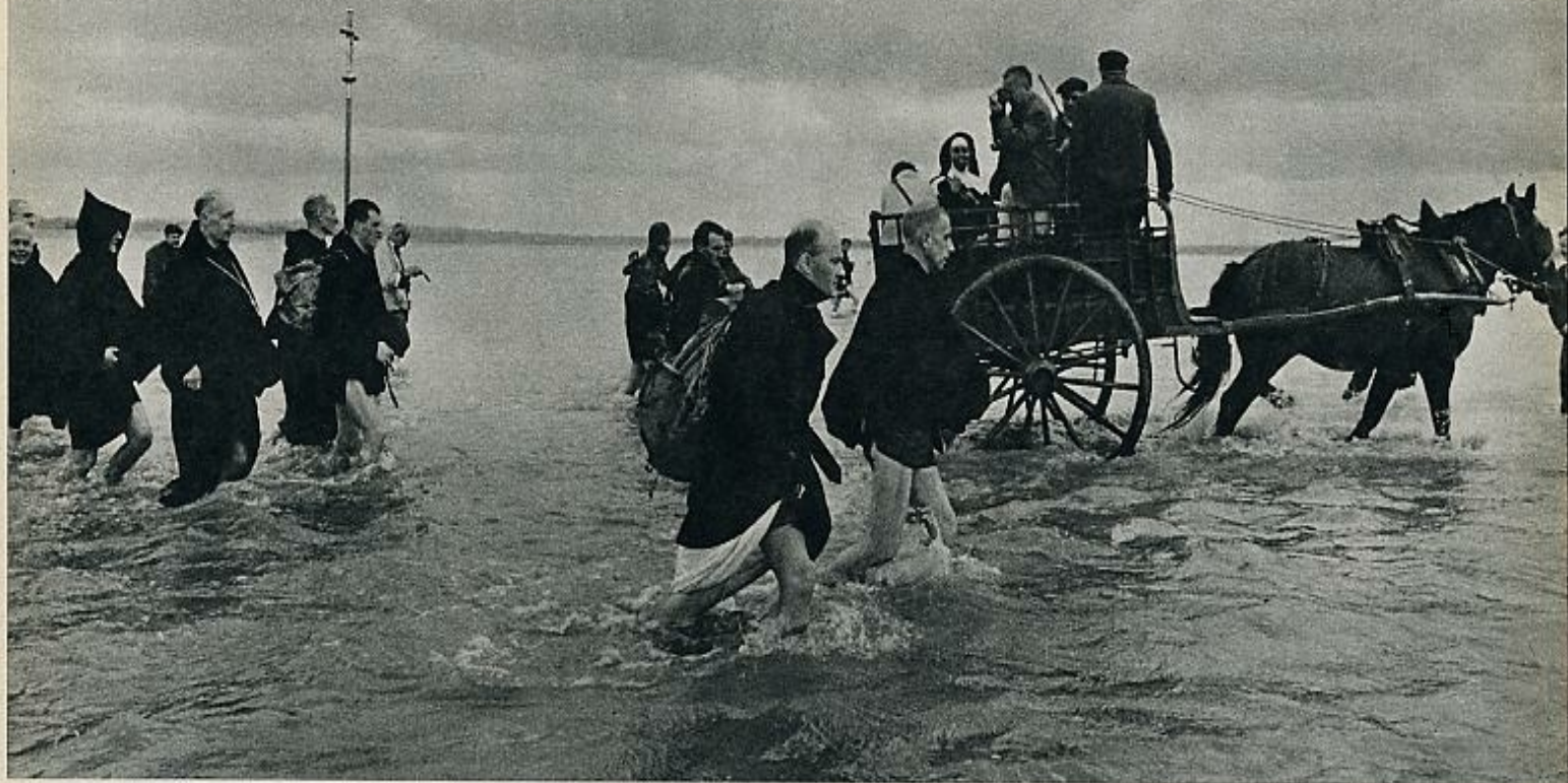
marcha hacia la abadía del Mont Saint-Michel. Con los monjes iban mil peregrinos que acudían para tomar parte en los actos de celebración del milenario.