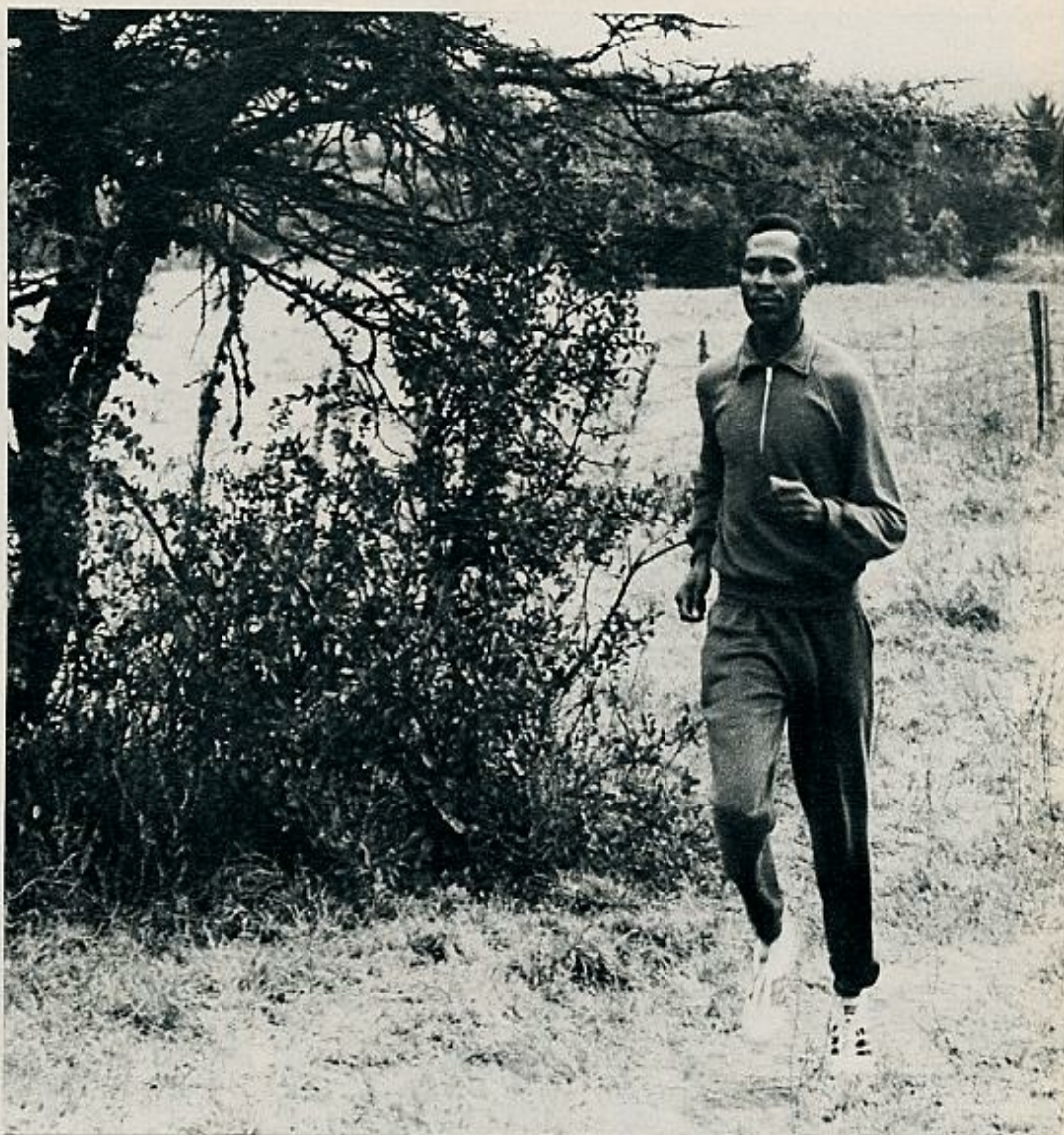
Arriba, Keino entrenándose al amanecer: diez kilómetros diarios de recorrido. Abajo, el campeón es profesor de la Escuela de Policía. Aquí aparece con sus alumnos, durante una de las clases que ofrece en el campamento.