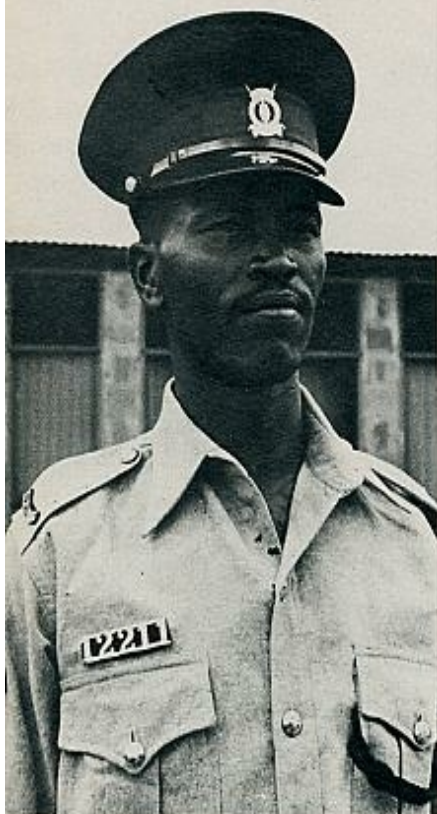
Kipchoge Keino ha sido ascendido a subinspector. Aquí aparece con el uniforme de cabo por última vez. En la otra foto, Keino durante uno de sus concienzudos entrenamientos.