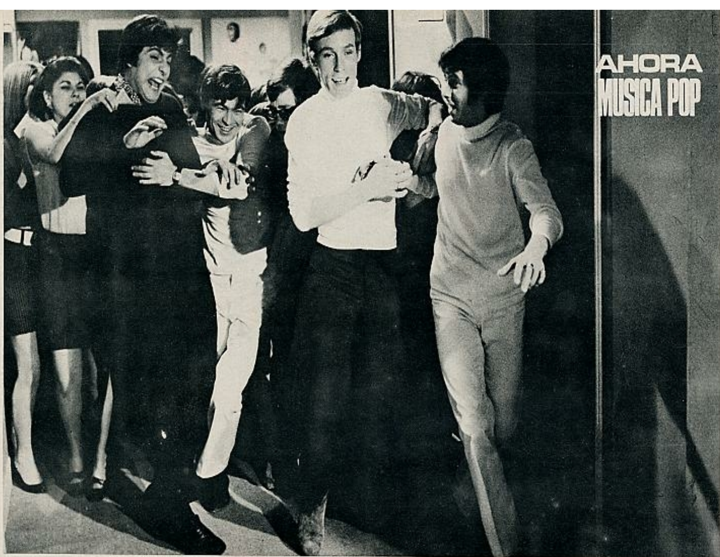
Las «fans» en acción, persiguiendo a sus ídolos después de una actuación. En la foto inferior, la «inundación», escena clásica en los anales del buen cine cómico.