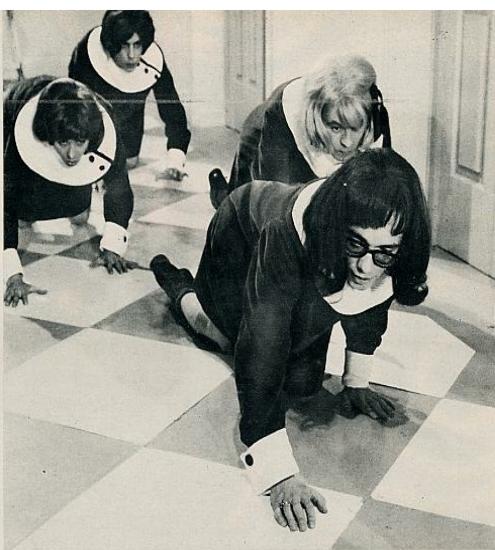
Los Bravos tienen que adoptar diversos disfraces para introducirse en un anticuado colegio de chicas.