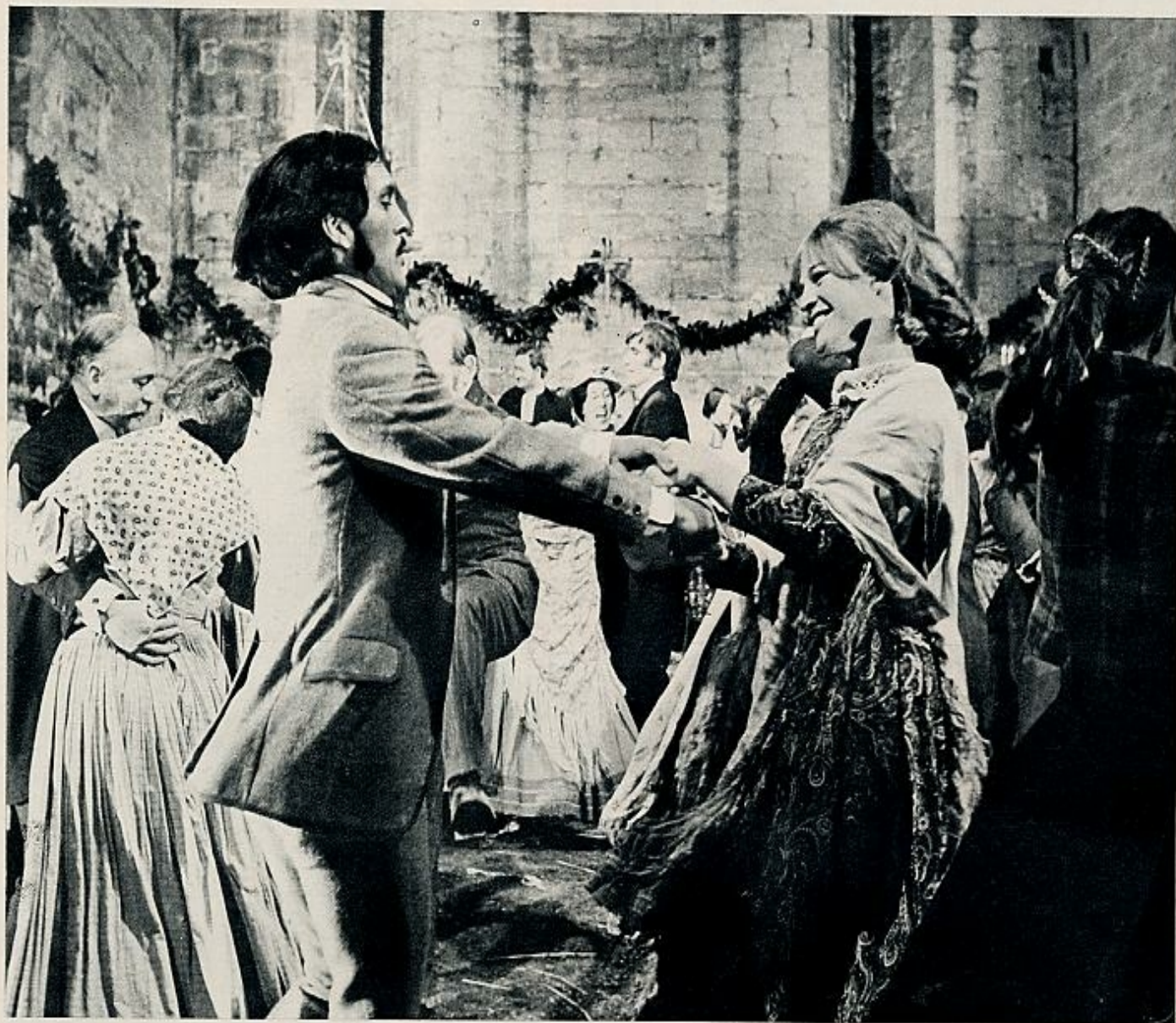
Julie Christie y Terence Stamp son los protagonistas de «Far from the Madding Crowd», según la novela del mismo título de Thomas Hardy. La película está dirigida por John Schlesinger, que descubrió a la actriz en «Billy Liar», y le proporcionó el Oscar de 1966 por su interpretación en «Darling». Julie Christie en su apartamento.

nido oportunidades de convertirse en estrella y las ha rechazado. Y aunque su cotización internacional la haya elevado a esa categoría, Julie es en realidad una actriz, una trabajadora del espectáculo —como lo son por otra parte sus compañeros—, que lo único que pretende es trabajar en buenas películas con buenos directores.