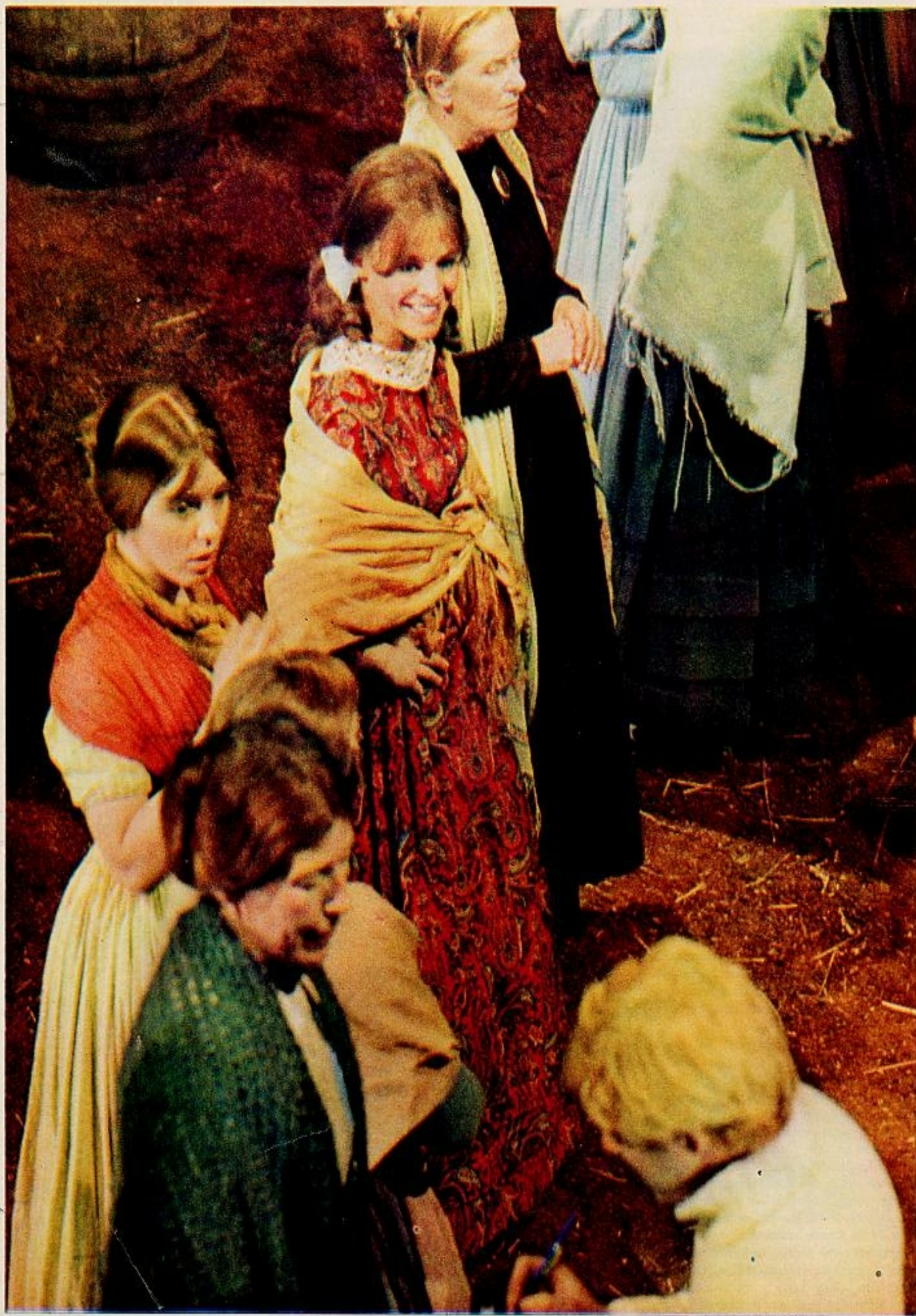
La acción de la película transcurre a finales del siglo pasado, en el condado de Dorset, donde nació el novelista Thomas Hardy. Trabajan también Alan Bates y Peter Finch.