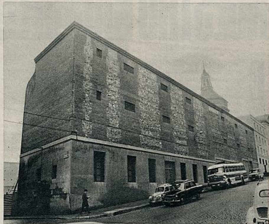
También el edificio de un viejo convento madrileño sirve como albergue escolar a cientos de chicas.

tener esta especialización. En 1963, siendo ya ministro el señor Lora Tamayo, se decide establecer un programa fijo y el «Preu» se convierte, de hecho, en un curso más. Los catedráticos, por su parte, plantean la conveniencia de que este «nuevo curso» se dedique a la cultura contemporánea, de tal forma que sirva a los alumnos para ponerse al día sobre la situación actual de las artes y las ciencias. Sin embargo, el concepto «contemporáneo», adelantado por los profesores, es interpretado, a la postre, en un sentido excesivamente amplio. Si se propone que la literatura empiece