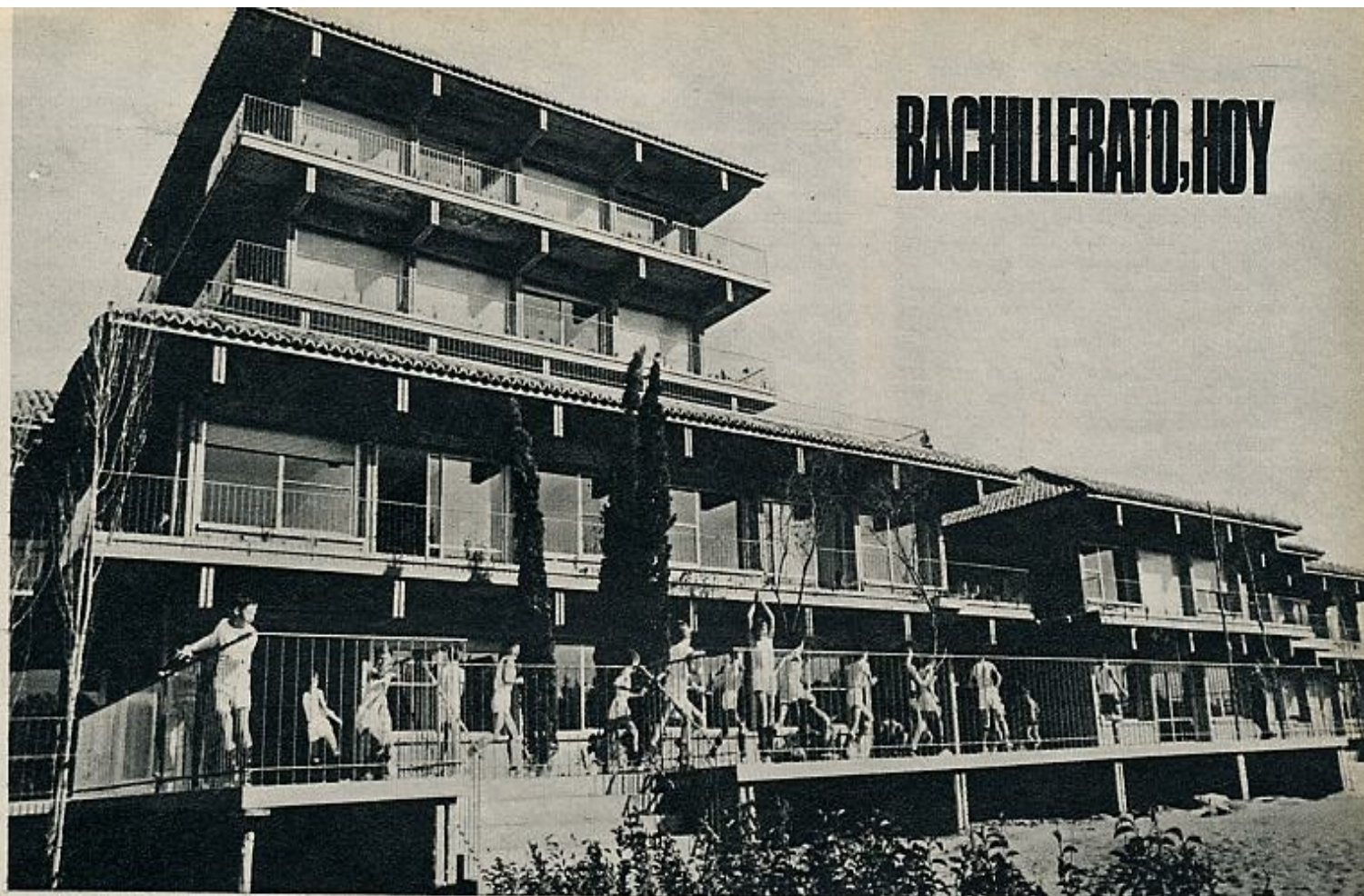
Estas modernas instalaciones pertenecen a un colegio de Aravaca, a algunos kilómetros de Madrid. Los chicos, en traje deportivo, hacen gimnasia al aire libre en la terraza.

de instrucción por clases sociales de la población activa» para 1960: