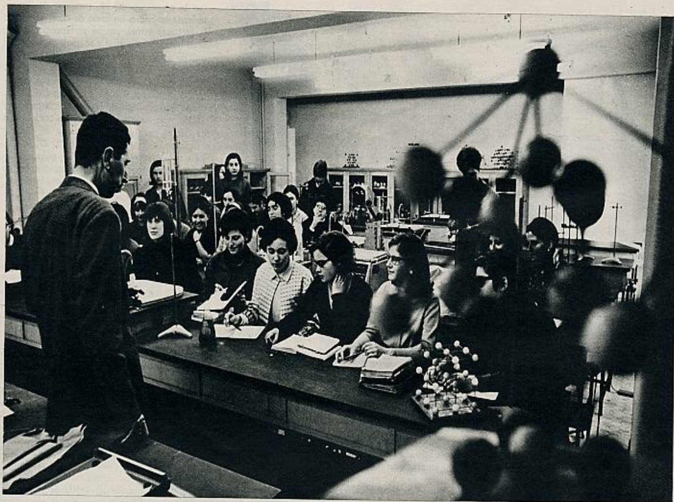
El acceso de la mujer a la segunda enseñanza ha continuado un proceso ascendente. En la fotografía, un grupo de chicas asiste a una clase de física y química.