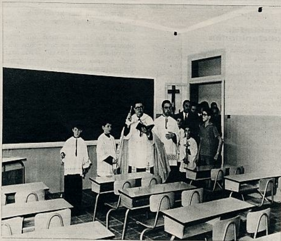
La Iglesia acoge en sus colegios a la mayoría de los alumnos de nuestro país. En la fotografía, un párroco bendice las nuevas instalaciones de un grupo escolar en un barrio de los suburbios de Madrid.

«El año pasado fue importante y, al mismo tiempo, penoso para nosotros. Nos aumentaron el sueldo en un veinticinco por ciento, pero tenemos que trabajar un cincuenta por ciento más. Según los franceses, cada hora de trabajo en la enseñanza hay que contabilizarlo como dos en cualquier otro trabajo. Pues bien, la reforma del 65