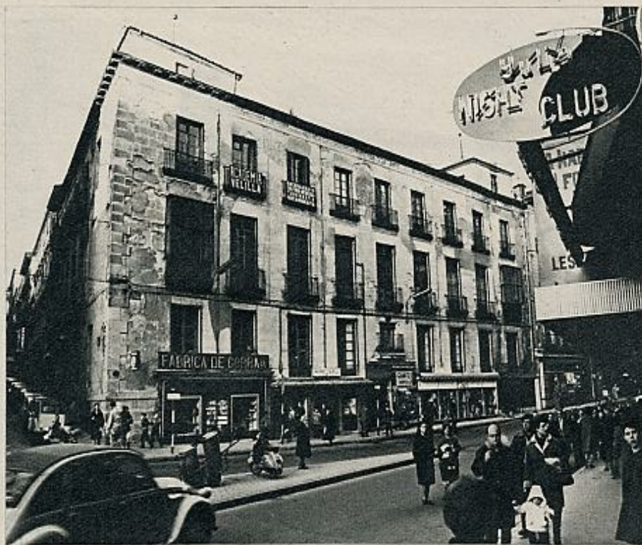
Muchos de nuestros escolares no encuentran plaza en los Institutos y colegios reconocidos por el Ministerio de Educación. Se ven obligados a estudiar como alumnos libres en sus casas o en academias privadas.

superiores y al examen se le pone el nombre de «prueba de madurez».