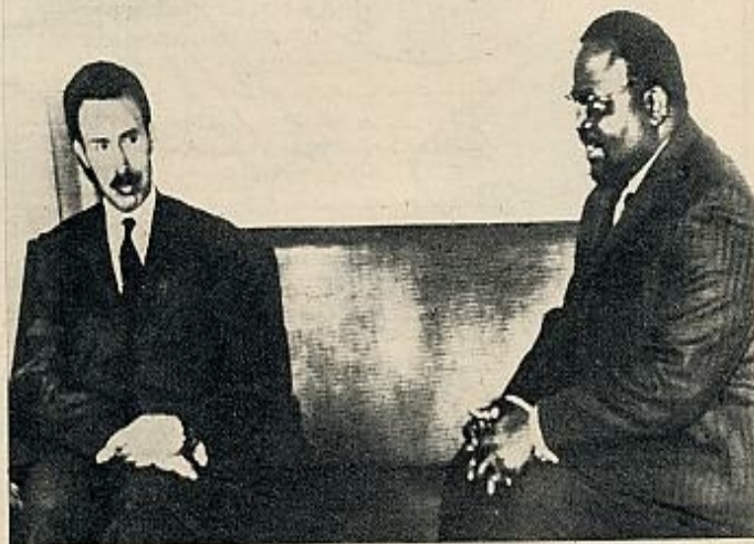
Bumedian y Mungul Diakha, ministro de Estado congoleño, durante las conversaciones sostenidas recientemente sobre el futuro de Tshombé, nudo de secretos africanos.