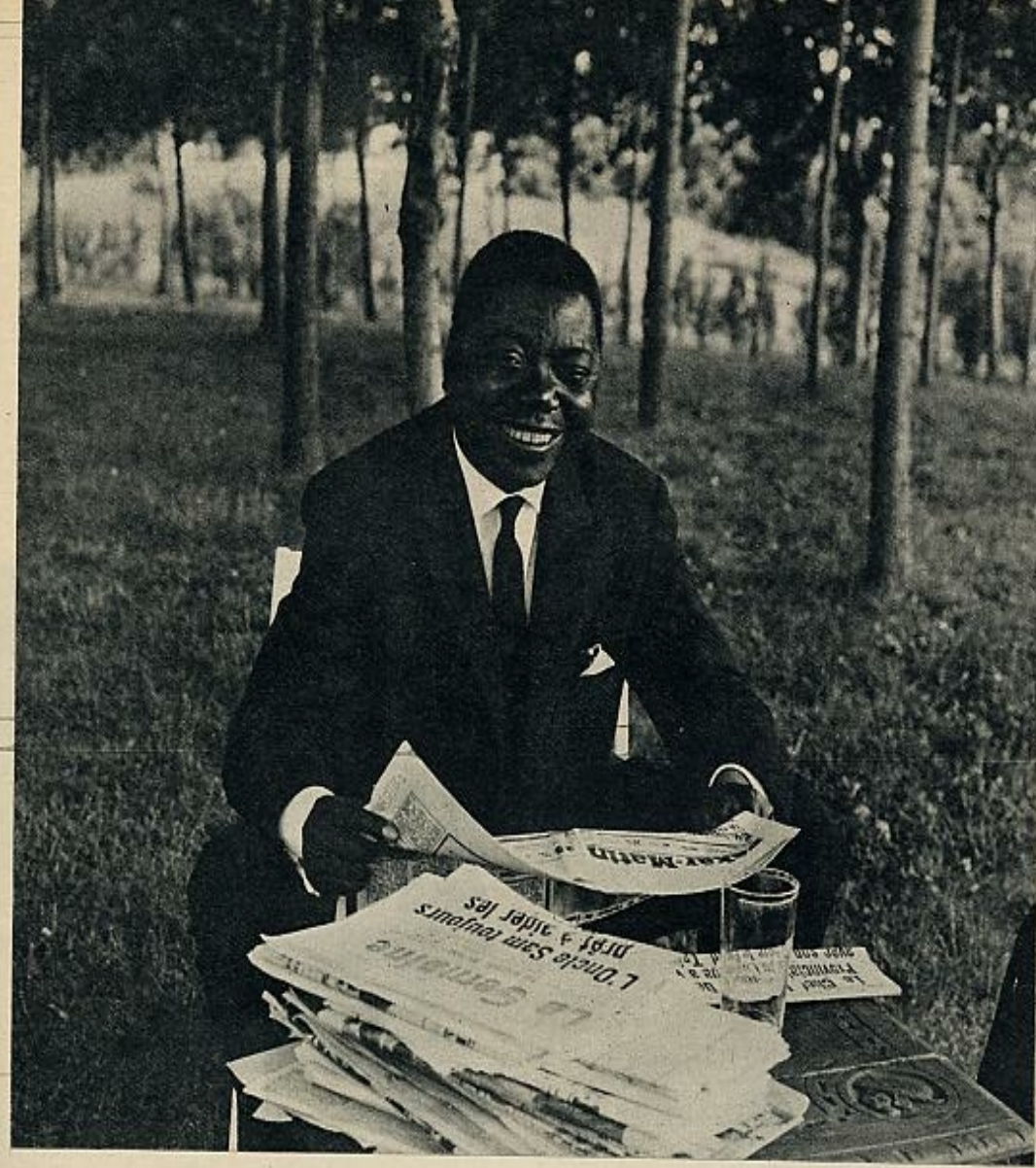
Moisés Tshombé: el cuchillo político que separaría los intereses del África negra y del mundo árabe.

En lo que respecta a Bumedian, el interés de los argelinos radica en arrancar a su prisionero todos los secretos de los que es depositario, ya que en el ex ministro congoleño confluían los hilos de muchos servicios secretos y las actividades de muchos servicios especiales del mundo entero. Bumedian comprobará ahora en qué grado de intensidad se hallan las relaciones de Tshombé con los servicios especiales americanos e israelíes. Según esos servicios, Tshombé era el campeón del Occidente en el corazón de África. Un comentarista moderado señala sin ambages la prosperidad y el orden que el ex ministro trajo a su país en dos años de gobierno frente al caos y la anarquía que reinaron en los cuatro meses de Lumumba. Incluso en un momento, Tel-Aviv había planteado una especie de Santa Alianza del África, regentada, por supuesto, por los hombres de negocio, de la que formarían parte África Portuguesa, África del Sur y sus dependencias, Etiopía, Costa del Marfil y Madagascar. Se lograría así una entente bajo la advocación de Moisés... Tshombé. Lo cual equivaldría a una cruzada contra