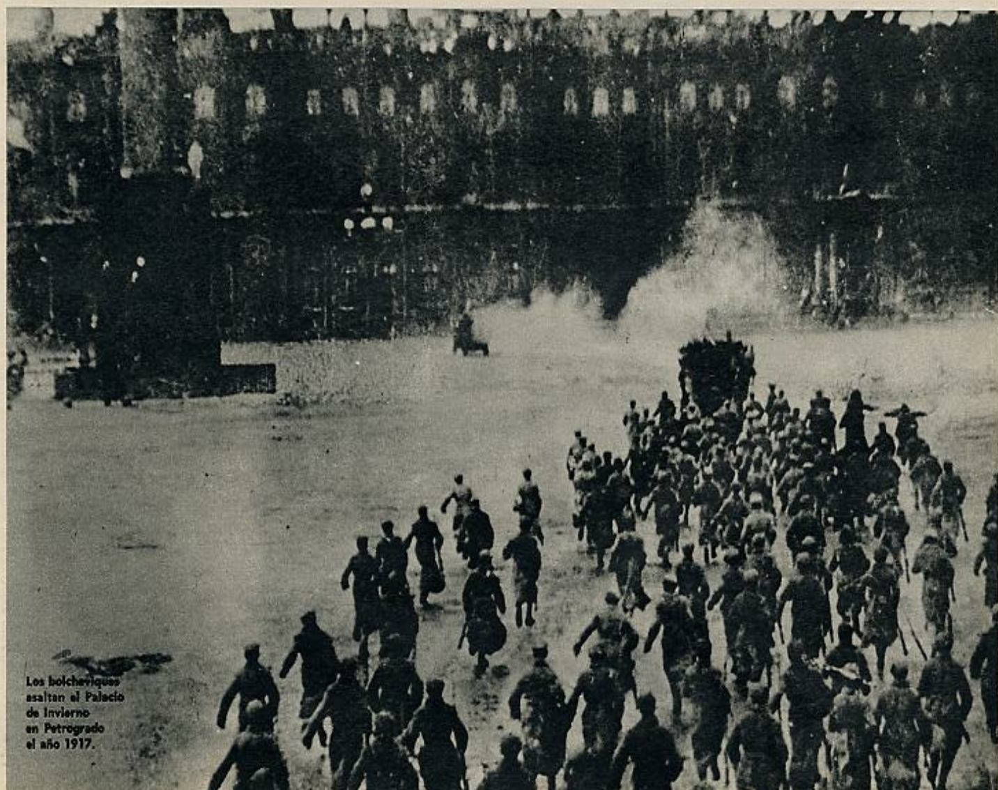
Los bolcheviques asaltan el Palacio de Invierno en Petrogrado el año 1917.