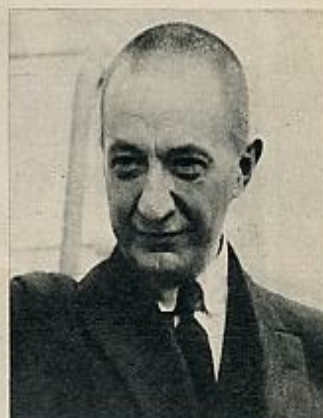
Alejandro Kerensky: la última carta reformista favorecida por los poderosos.