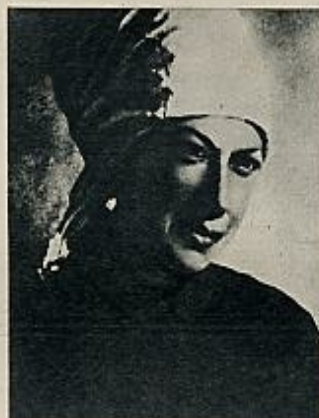
Arupskaja, la mujer de Lenin, vestida de obrera. Así cruzaba la frontera.