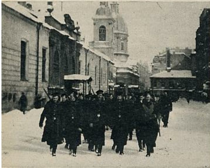
Los marinos sublevados de Cronstadt llegan a Petrogrado, formaron parte de las fuerzas que atacaron el Palacio de Invierno el 26 de octubre (8 de noviembre).

La primera definición oficial del comunismo data de 1847. Antes, era «un espectro», como decía Marx, que obsesionaba a Europa. «Todas las potencias de la vieja Europa se han agrupado en una santa cacería para atrapar ese espectro: el Papa y el Zar, Metternich y Guizot, los radicales franceses y los policías alemanes. ¿Cuál es el partido de oposición que no haya sido acusado de comunismo por sus adversarios en el poder? ¿Cuál es el partido de oposición que no haya estigmatizado con el reproche infamante de "comunismo" a sus adversarios de derecha o de izquierda?». Las palabras de Marx y Engels que preceden al «Manifiesto del partido comunista» (Londres, 1848) tienen una curiosa actualidad; 120 años después, la palabra de «comunismo» o «comunista» se sigue aplicando con una delirante facilidad a todo aquello que, por algo, hay que perseguir. Marx y Engels pretendían con el manifiesto exponer ante el mundo entero sus conceptos, sus objetivos, sus tendencias y oponer «a las leyendas del espectro comunista un manifiesto del partido en sí mismo». El comunismo era en aquel momento una de las muchas formas del socialismo, el cual había aparecido simultáneamente con la revolución industrial y SIGUE