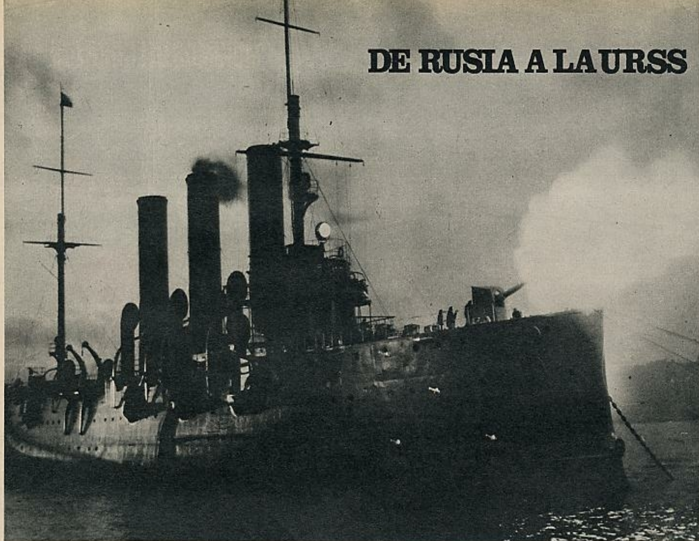
El crucero-acorazado «Aurora», cuya actuación en favor de los bolcheviques fue decisiva para la toma del poder en Petrogrado y el triunfo de la revolución.

mientos interiores. Ciertamente, los horrores de la guerra se cebaron contra el pueblo mientras dejaban intacta la corte zarista, embaucada en sus supersticiones, adoradora del falso monje Rasputín, y a los señores feudales. La pobre economía primitiva del país no podía soportar el esfuerzo de guerra; la corrupción en las altas esferas —en la adquisición de material de guerra— era grave y las tropas rusas, mal alimentadas y mal equipadas, sufrían continuas derrotas. Se sospechaba que la corte estaba más a gusto en la guerra; que hubiese preferido estar al lado de los alemanes, y que estaba, incluso, dispuesta a cambiar repentinamente sus alianzas —se ha dicho de Rasputín que era un agente alemán, lo cual no se ha probado nunca; pero sí es cierto que la zarina era alemana—. Los precios subían a una velocidad vertiginosa, pero los industriales, los propietarios y los aristócratas realizaban importantes beneficios. Los alemanes habían invadido Polonia, Rusia Blanca, los países bálticos: millones de refugiados se iban hacia el interior del país. Un espantoso invierno cayó sobre Europa, agravando las circunstancias de la guerra. Se produjeron un cierto número de insurrecciones y de movimientos de masa. En 1914 había habido unas 70 huelgas, en la que participaron 35.000