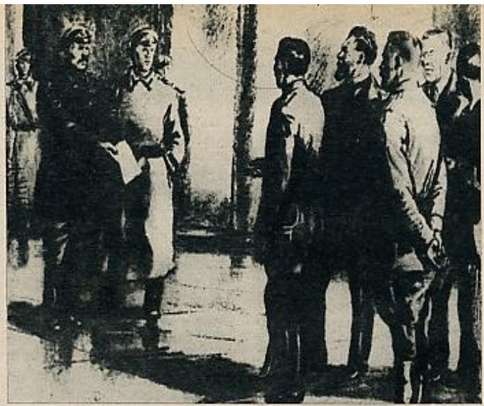
El Comité Militar Revolucionario presenta el ultimátum al gobierno provisional el día 25 de octubre, es decir, el día 7 de noviembre (cuadro de D. A. Shmarinov).

Rusia seguía siendo un mundo aparte y el nuevo capitalismo se presentó con condiciones de ferocidad. La jornada de trabajo en las fábricas era de 12 a 14 horas diarias y, en algunas de ellas —las textiles—, de 15 a 16 horas. El trabajo de las mujeres y los niños se equiparaba en rudeza al de los hombres, pero los salarios eran notable-