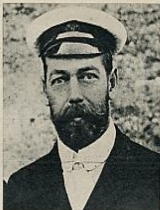
El Zar Nicolás II: últimos días de la imagen tradicional de la vieja Rusia.