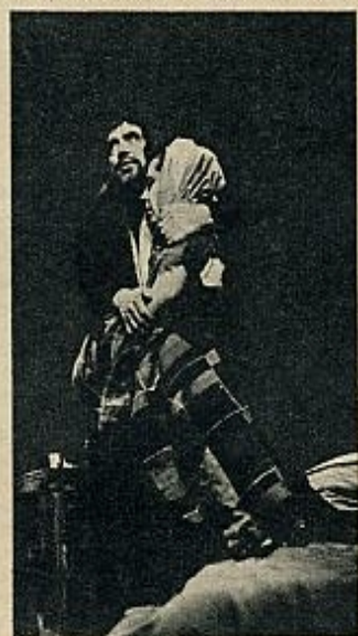
LOS BAJOS FONDOS

En España, la Restauración fue, por definición, la negación de la