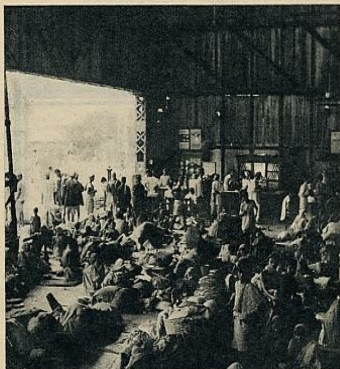
LA SUPERPOBLACION, PROBLEMA DE TODOS

mento empieza la vida? ¿Equivale a un aborto?). El esterilete se emplea predominantemente en los países de escasa cultura: los Estados Unidos envían millones a ciertos países (en la India: 518.000 esteriletes en 1965, 1.250.000 en 1966, 3 millones en 1967; en Corea del Sur: lo llevan 17 por ciento de las mujeres entre veinte y cuarenta y cuatro años). Debe colocarse un especialista; sólo un especialista los puede retirar. La esterilización masculina plantea graves problemas morales; una vez realizada, es definitiva y corta para siempre la libertad de engendrar.