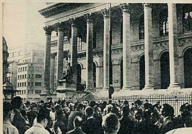
La Bolsa de París, cerrada. Se habían fugado 2.500 millones de dólares en francos y aún De Gaulle no se había dirigido al país.