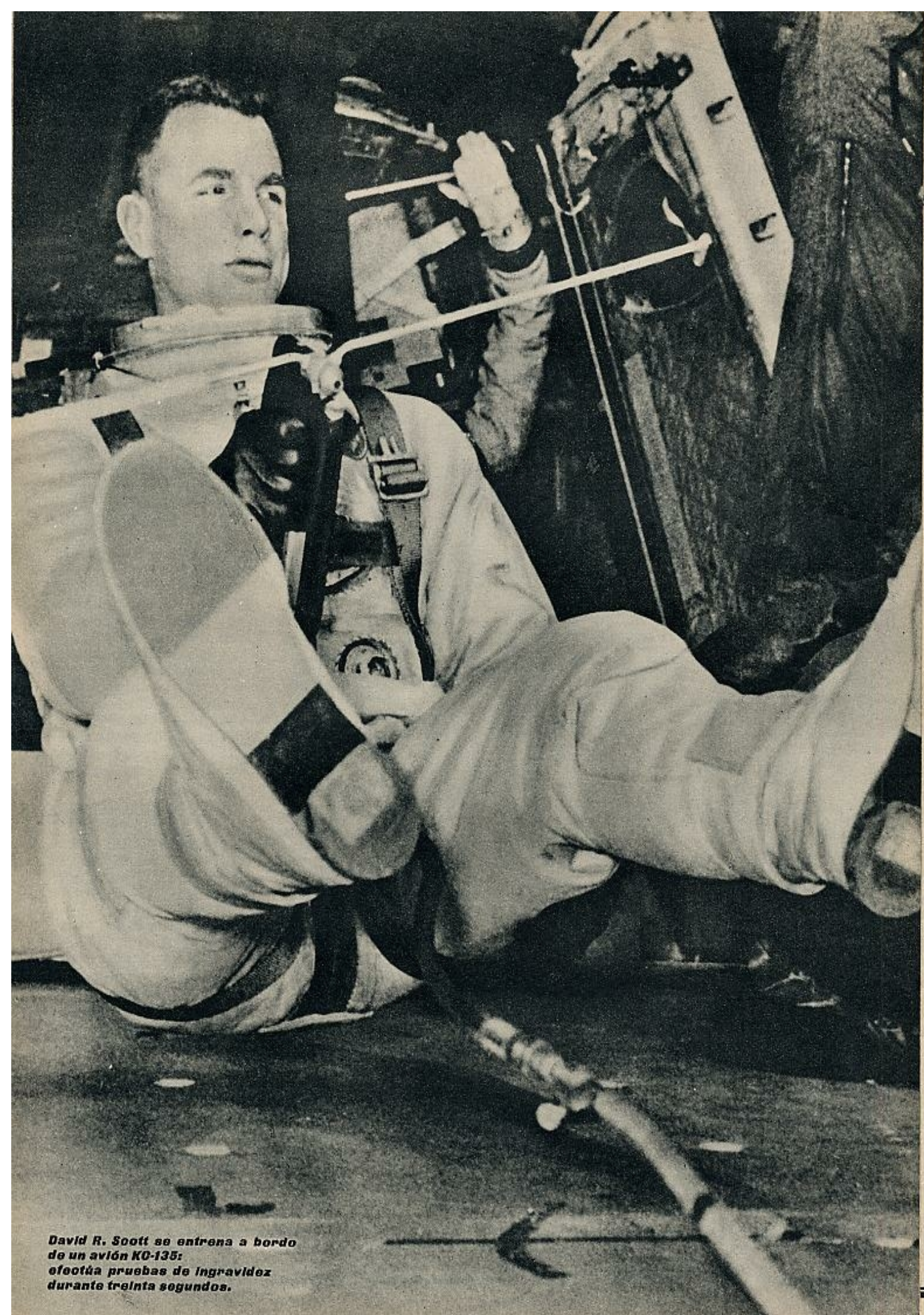
David R. Scott se entrena a bordo de un avión KC-135: efectúa pruebas de ingravidez durante treinta segundos.