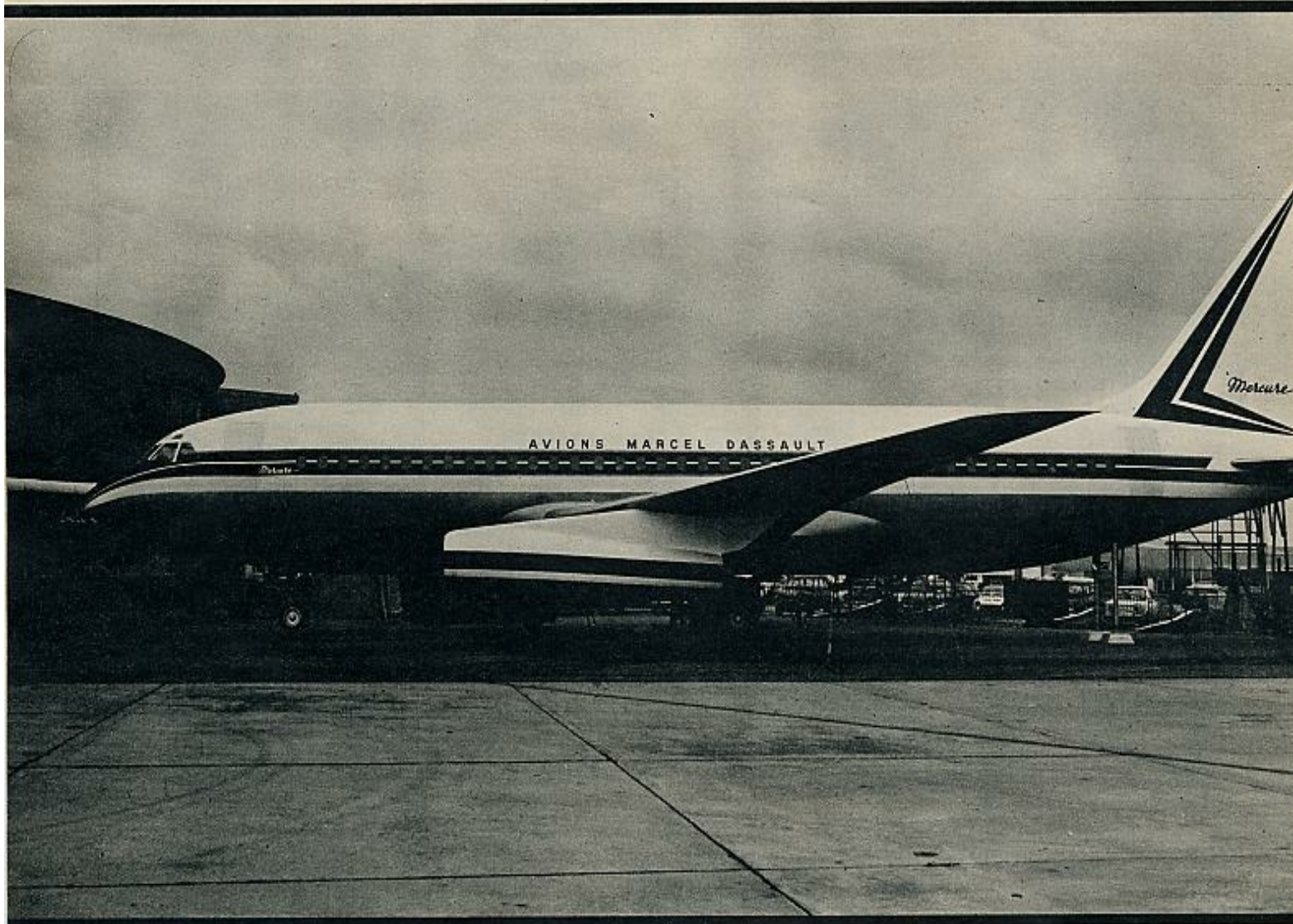
Maqueta del «Mercure». Estudiado para etapas cortas y con una capacidad de ciento cincuenta plazas, es un birreactor bastante grande —treinta y cinco posibilidades de llevarse el mercado de su categoría, estimado en millar y medio de aparatos para la próxima década. En la construcción del «Mercure»