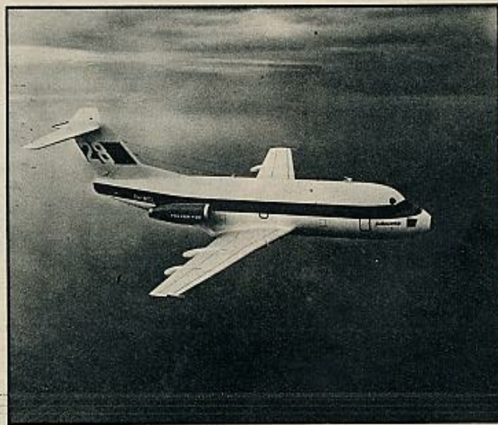
De izquierda a derecha: el «Fokker F-28», el futuro «Airbus» y el «Tupolev» cientos kilómetros y puede llevar sesenta pasajeros. El «Airbus» llevará cerca

te, es algo nuevo. Sí, en cada fila de asientos pueden ir seis, ocho, nueve o diez pasajeros, según la acomodación que se adopte, con lo que el número de plazas del avión puede variar desde un mínimo de 374 —36 en primera y 318 en turista— a 490 en versión turista, con asientos en filas de a diez. Sin embargo, se adoptarán como máximo los nueve asientos por fila, lo que permitirá un total de 446 plazas. Lógicamente no es posible manejar esa masa con un único pasillo central, por lo que hay dos longitudinales, cortados por cinco corredores transversales, que desembocan en las puertas de acceso al avión. Este monstruo lleva cuatro enormes reactores P & W, de casi 20.000 kilos de empuje unitario, doble fuerza que cualquiera de los comerciales actualmente en uso, cuya velocidad supera ligeramente. Pesa al despegue más de 320 toneladas, y su radio de acción es intercontinental. Tiene el mérito de ser el primer avión gigante de pasaje-