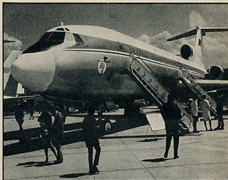
Tu-154». Junto a los gigantes intercontinentales como el «747» se precisan aviones para distancias menores. El «F-28» sirve para etapas de unos mil ocho de trescientas plazas a dos mil doscientos kilómetros. El «Tuvolev» puede llevar ciento sesenta y cuatro personas a una distancia de cinco mil kilómetros.

ros, pues el más lento «Antonov An-22», que los soviéticos presentaron hace cuatro años, hasta ahora sólo existe en versión de carga, y no de pasajeros. El «747» ha abierto el camino. En construcción están los trireactores Douglas «DC-10» y Lockheed «TriStar», también con amplio fuselaje, pero destinados a etapas medias.