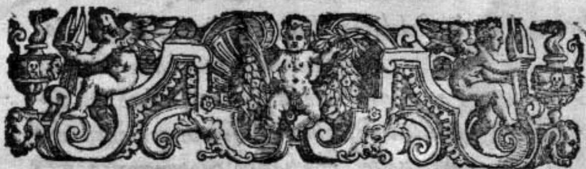
TAVOLA DELLE MATERIE, CHE IN QUESTI LIBRI Della vita Politica si contengono.