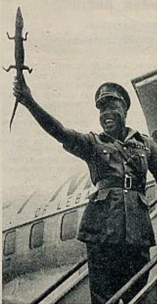
IRONSI, UN IBO REPRESENTATIVO.

La misma situación se produce en el mundo de los negocios, en el que,