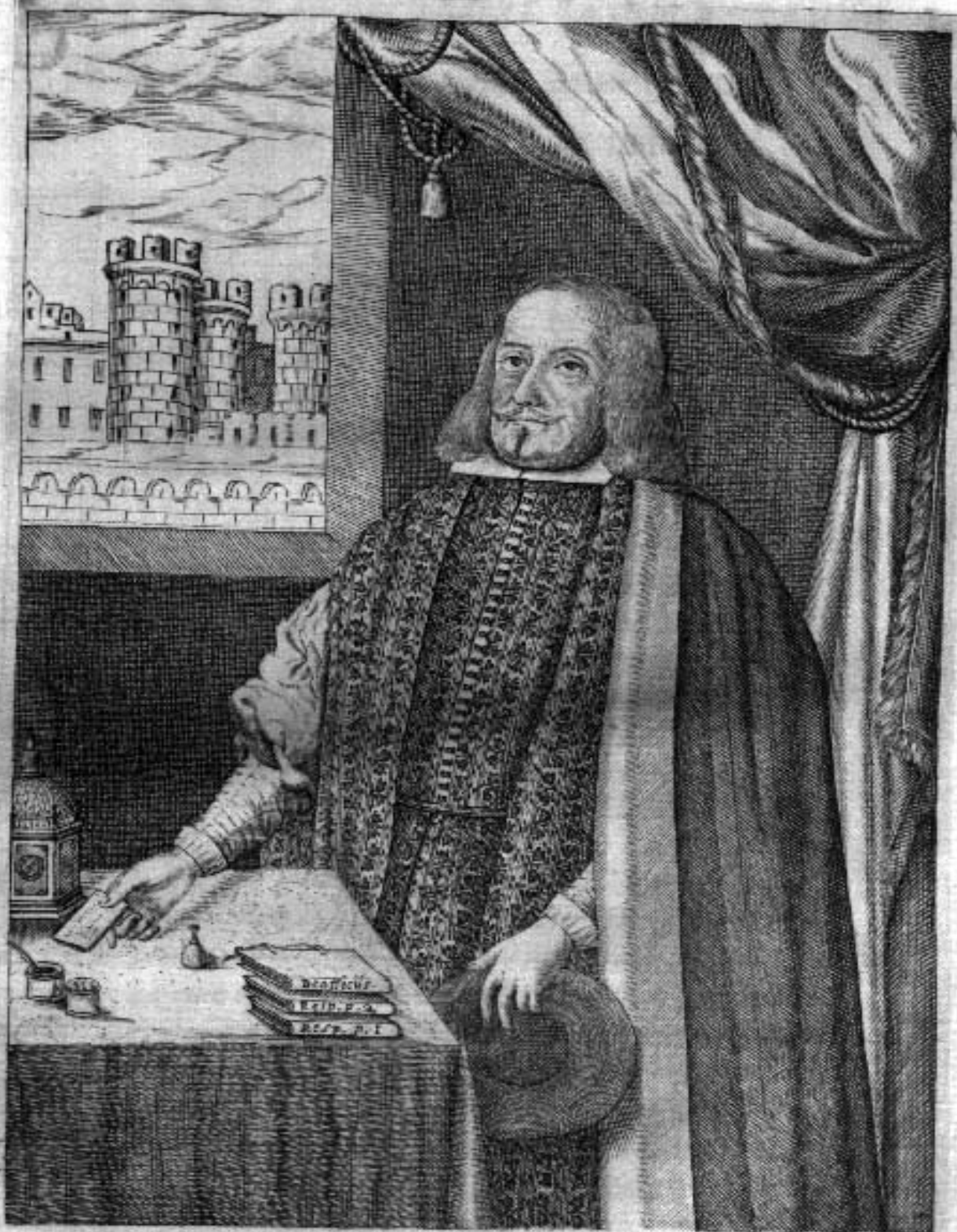
Franciscus Roccus Regius Consi