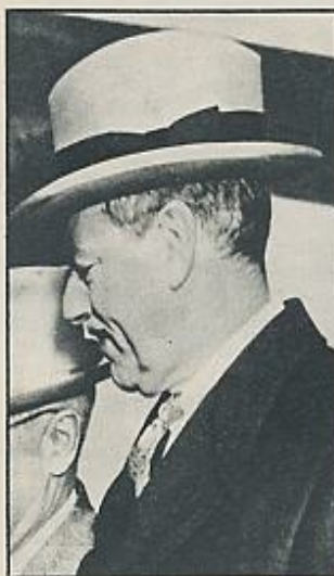
ACHESON: "TUVE MUCHO QUE HACER CON LOS SABIOS".