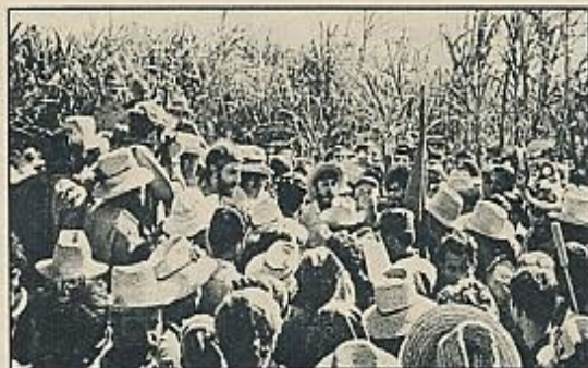
Fidel Castro, con los estudiantes norteamericanos.

número se va acercando poco a poco al millar. También se han integrado en las brigadas del corte los búlgaros voluntarios que trabajarán durante dos meses en la central «Cristino Naranjo» de la región de