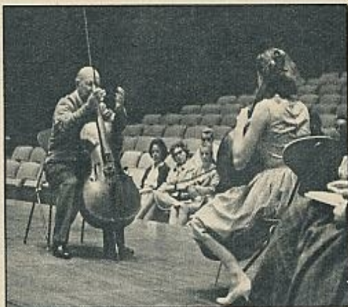
PAU CASALS, DURANTE UN ENSAYO.