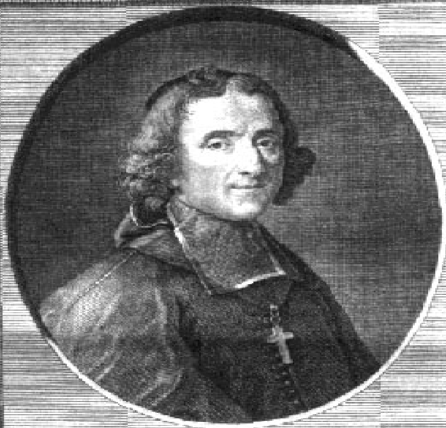
FRANÇOIS DE SALIGNAC DUC DE LA MOTHE FENELON.