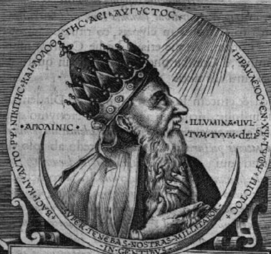
Heraclyj Imp. nummus aereus.