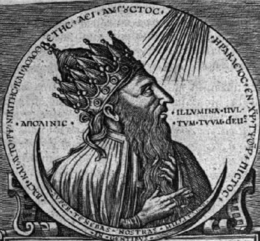
Heraclij Imp. nummus aereus.