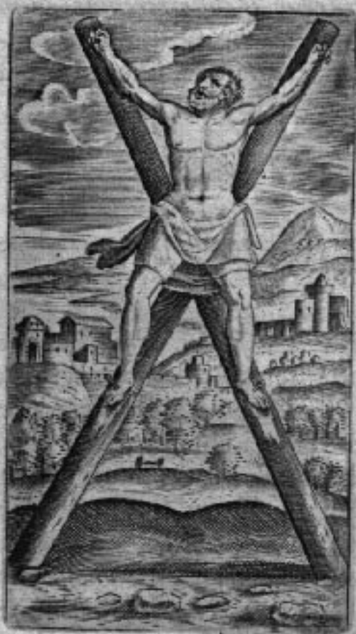
Cruce Sæ Andrea.

raël manus permutans, dextram quidem in iunioris, sinistram vero in senioris caput imponens. Et Tertullianum in istâ ipsâ re: Impositis & intermutatis manibus benedixit, & quidem ita transuersim obliquatis inter se, ut Christum deformantes, iam tunc portenderent benedictionem in Christum futuram. Quomodo Christum deformarunt illæ manus? imò Crucem: & sic mihi libido aliquando legere: sed refræno, & accipio Christum crucifixum. Hæc illa est quam Andream hodie dicimus, validâ & satis veteri famâ diuum istum in eâ cruciatum. Anne verâ? facit me ut am-