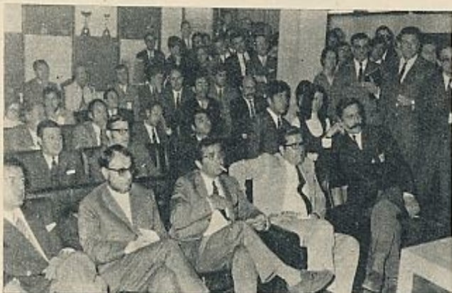
Aspecto general que ofrecía el local social de la AJEP, en el momento de las elecciones.