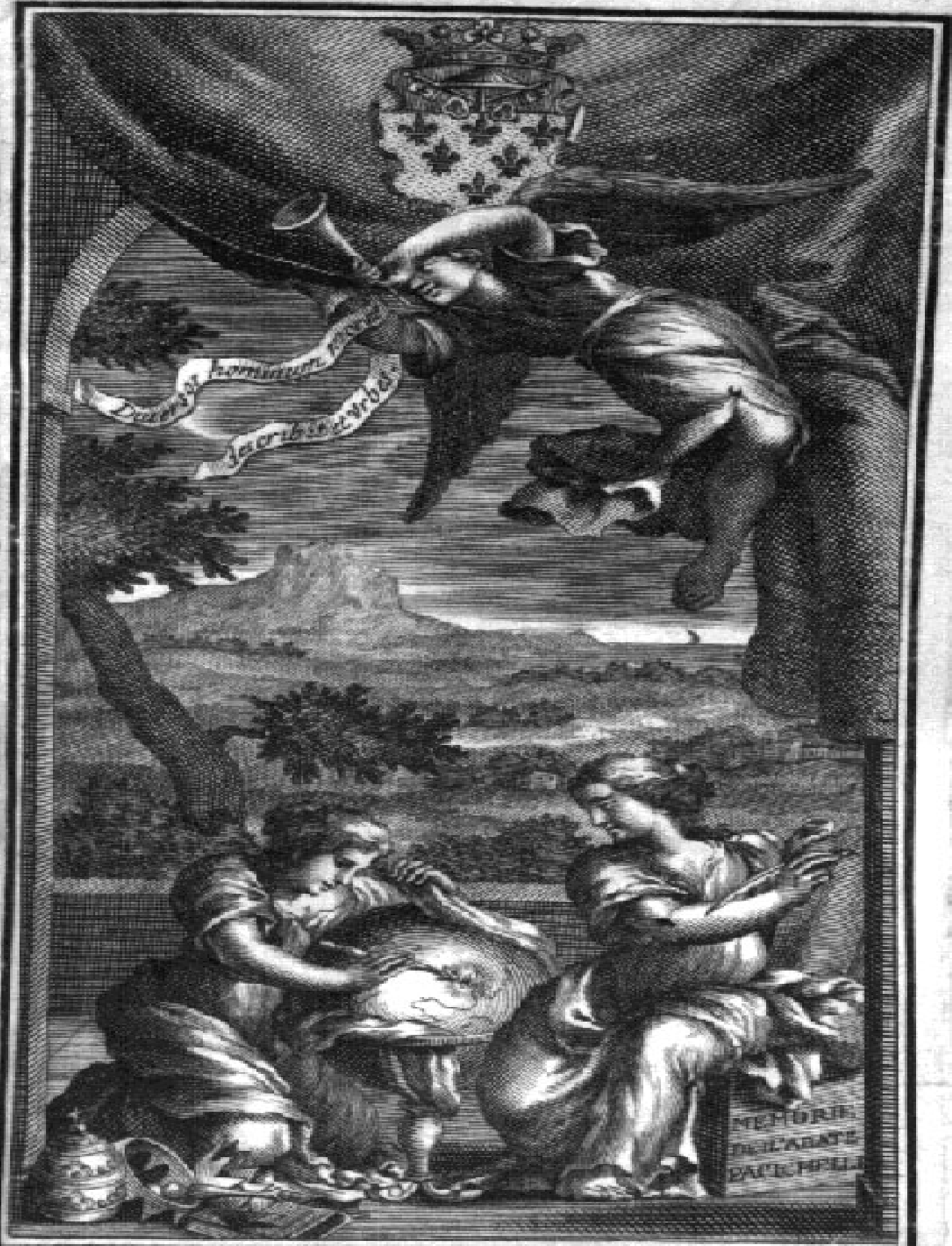
F. De Louvemont sculp.