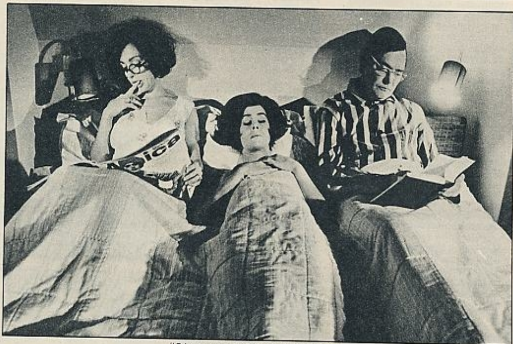
"Dúo para canibales", de Susan Sontag.