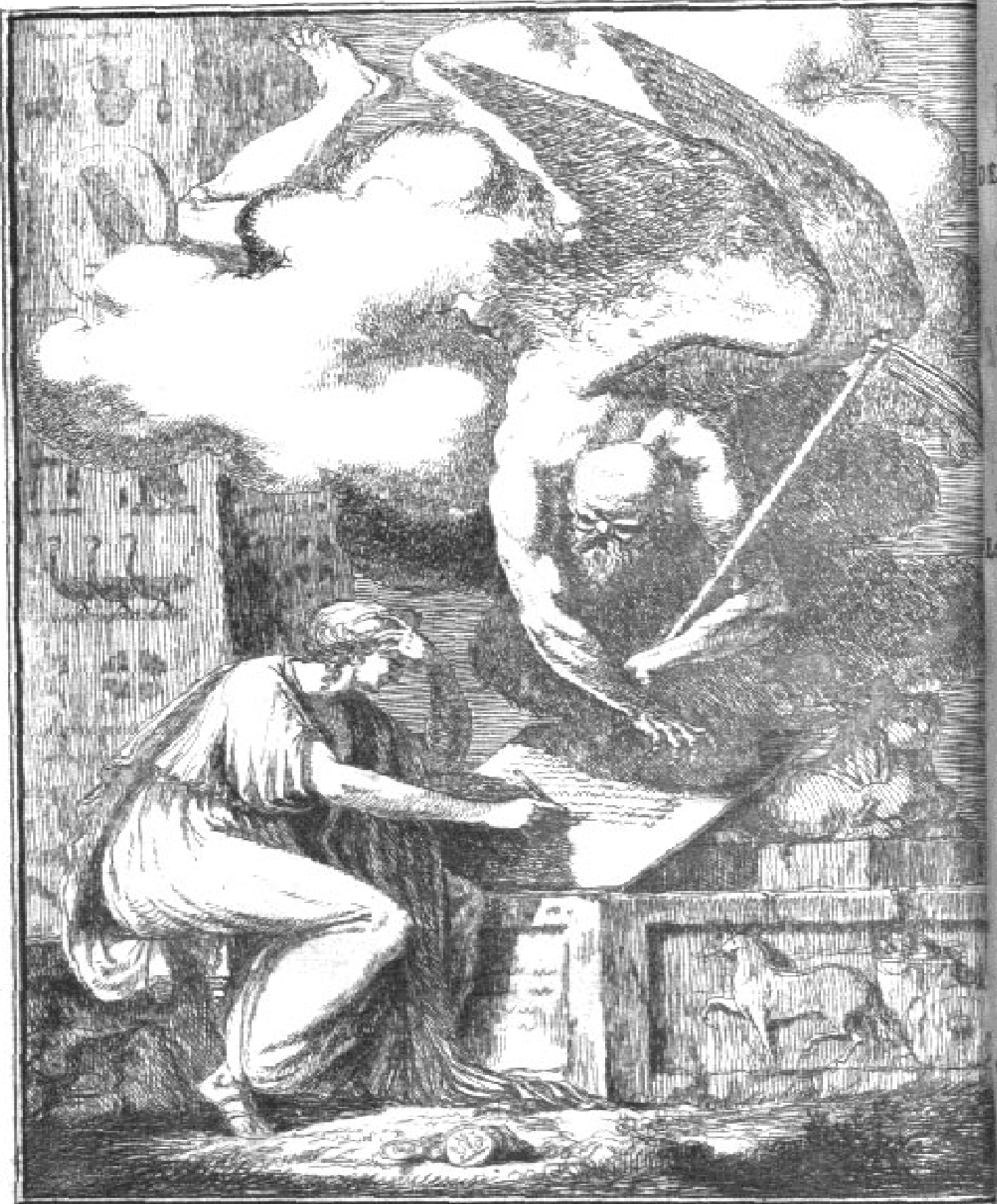
Tempus edax rerum. Spiritus Cibelinus inv. et fecit.