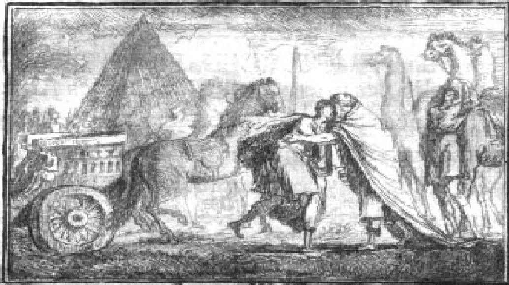
GENESE XLVI. 29.