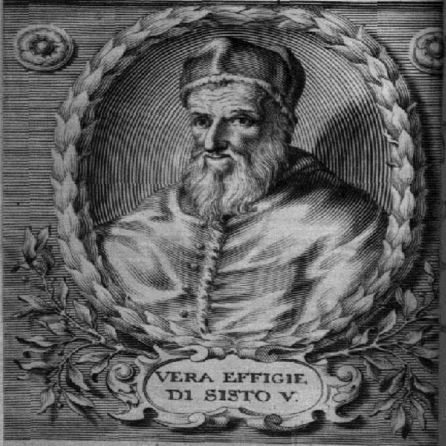
VERA EFFIGIE DI SISTO V.