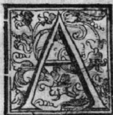
Fig. D. Hæc est. In his pars magna læcæ