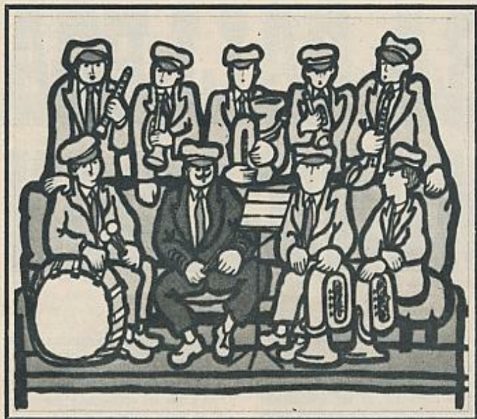
MARIA ANTONIA DANS.