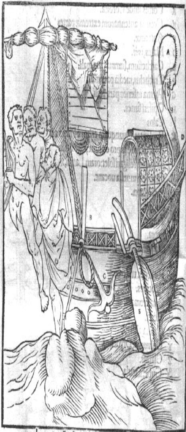
A \chi\lambda\iota\sigma\kappa\omicron , Anserculus. B Anchoralia. C Anchora. D Fori, hedolia. E \pi\eta\theta\lambda\iota\omicron\gamma , Gubernaculum, Temo.