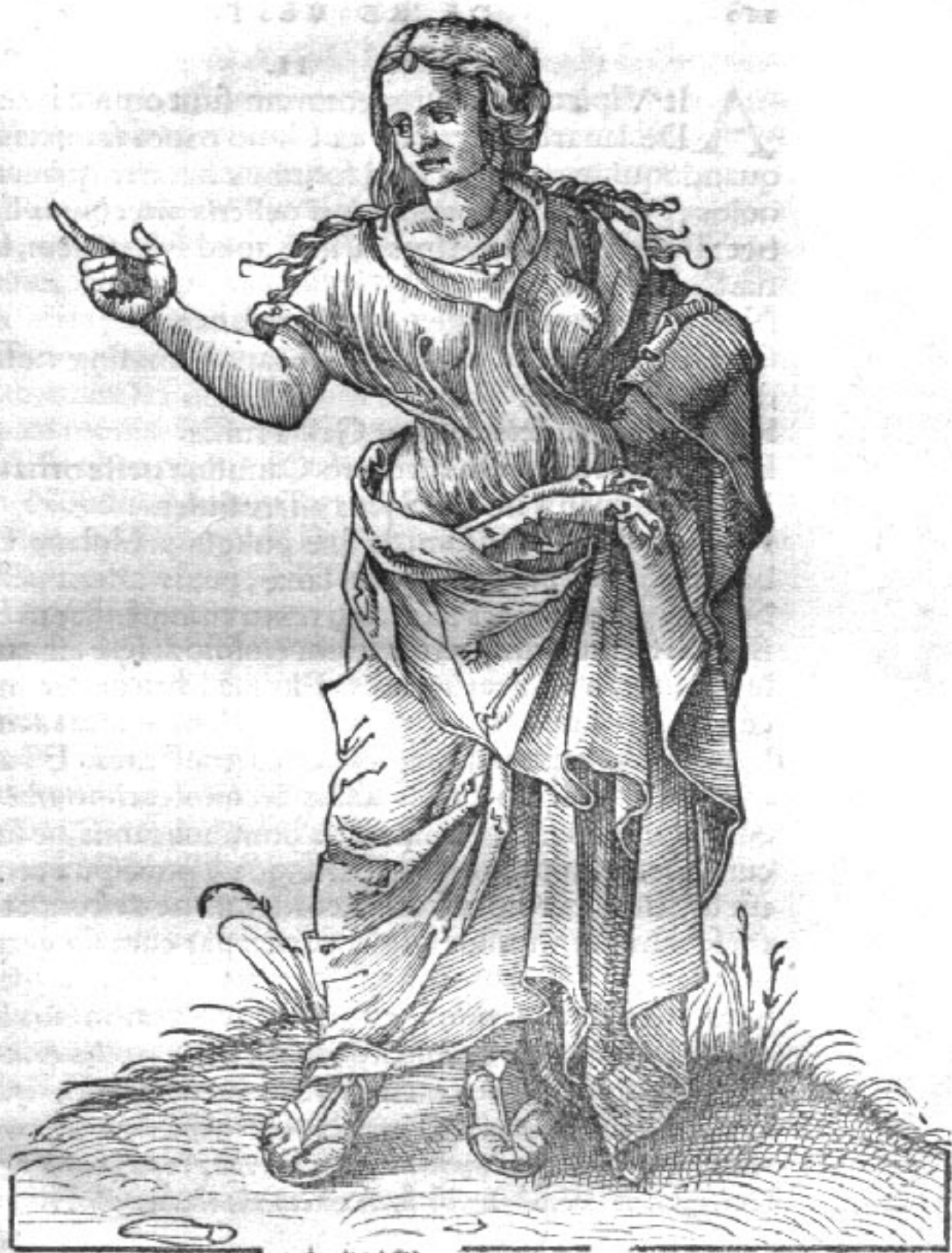
Stolata mulieris figura ex antiquissimis monumentis, quae etiam hodie Romae inveniuntur.