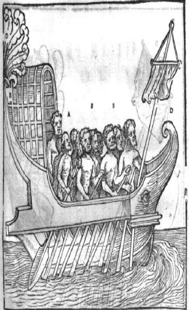
A Gubernator, \kappa\omicron\lambda\sigma\pi\upsilon\tau\eta\varsigma B Remiges, Nauta, \phi\epsilon\tau\alpha . C \pi\pi\omega\pi\epsilon\upsilon\varsigma \kappa\alpha\iota \pi\pi\omega\pi\alpha\tau\upsilon\varsigma , Latinis proreta, qui proram regit. Iureconf. in lege, Cotem. §. Dominus. ff. De publicanis. D Acroteria. E Thronus.