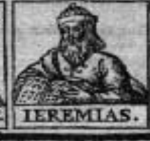
I E R E M I A S.