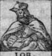
I O B.