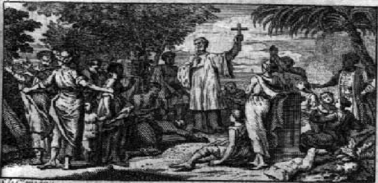
S. Francois Xavier annonce la Foy aux Indes.