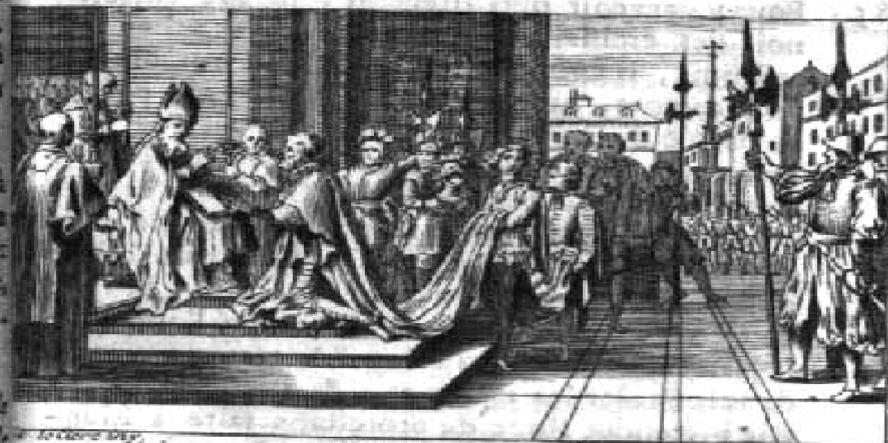
Abjuration de Henry IV à S. Denis.