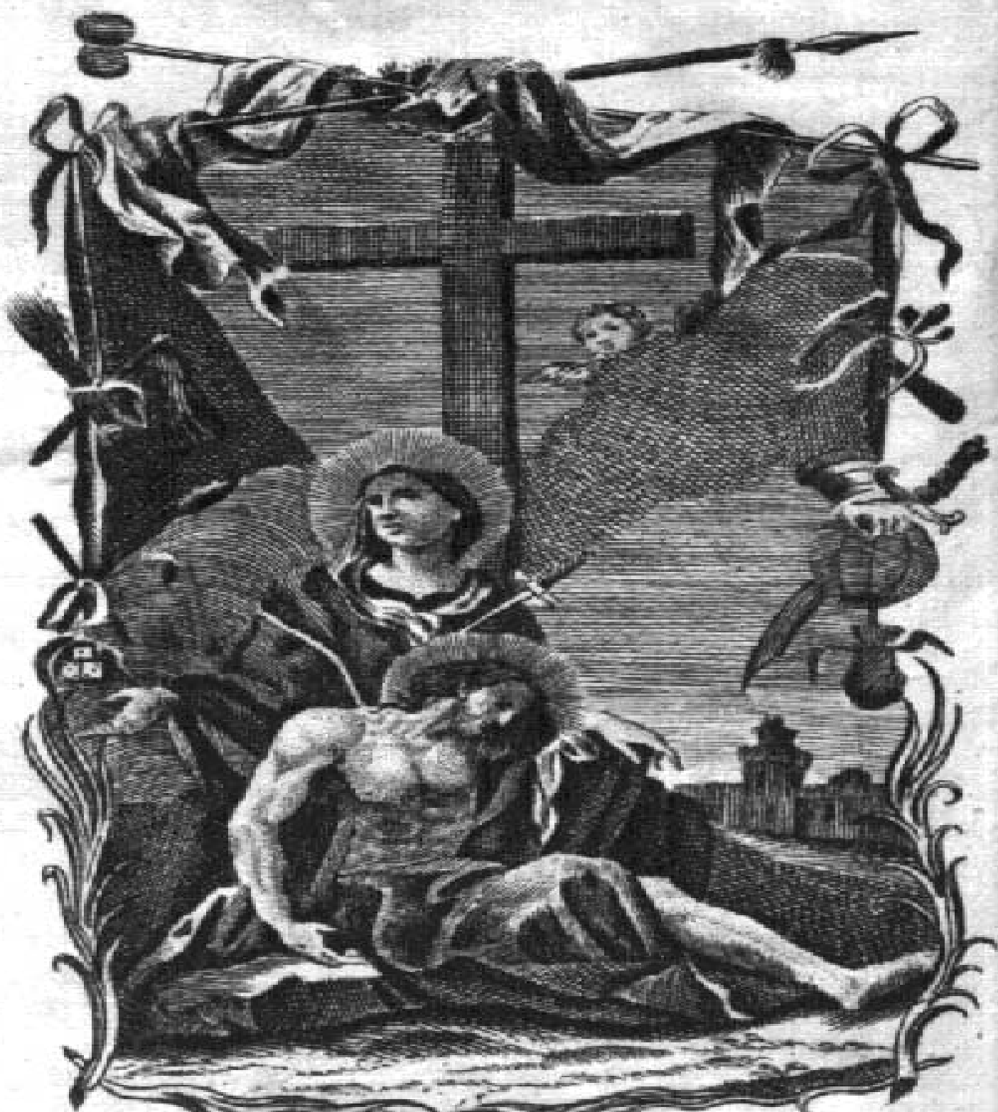
Mater Dolorosa ora pro nobis.