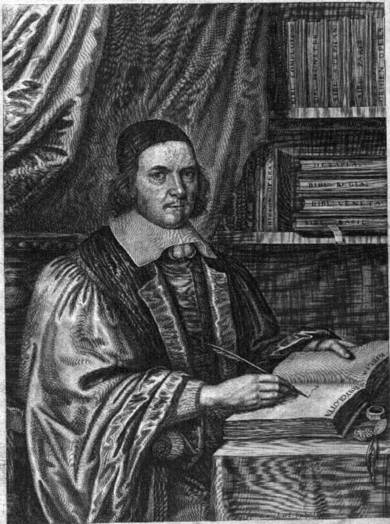
BRIANVS WALTONVS. E CLEVELANDIA IN BIBLIA POLYGLOTTA LIII. ABSOLVIT A. N. DCXLVII. A. S. T. D. CANTAB. COLL. S. PETR. COMITAT. EBORAC. INCHOAVIT A. DOM. MDC. AETATIS SVE. LVII.