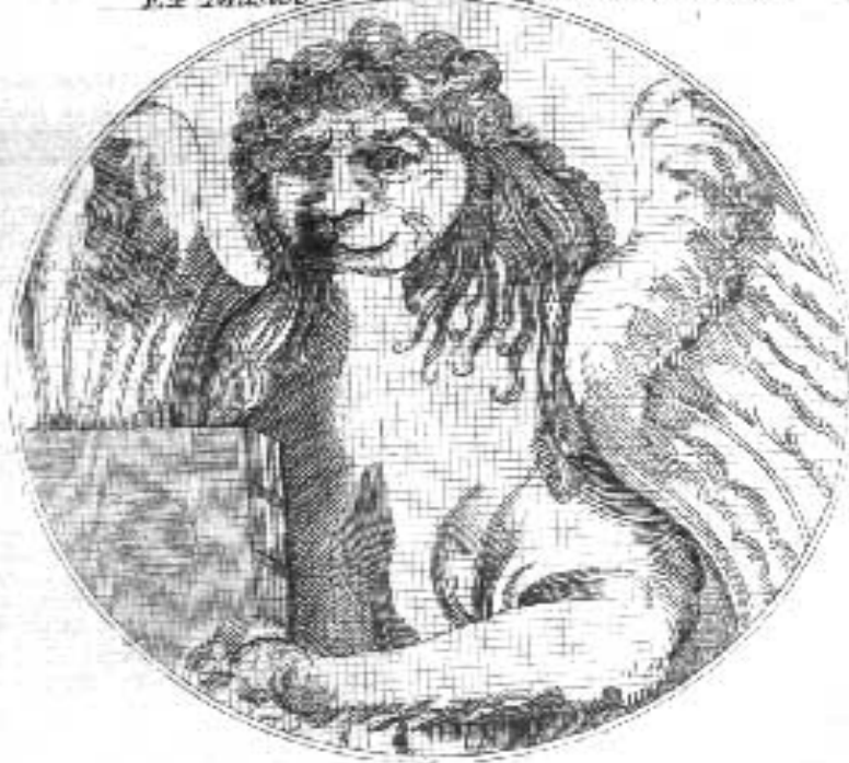
Eccles. S. Marci Romae.