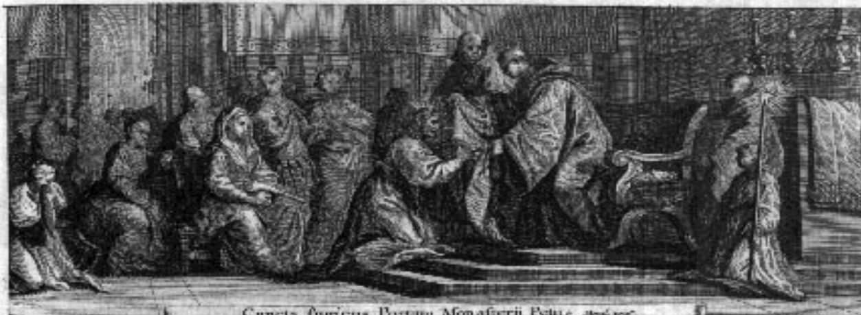
Cuncta fugiunt, Partem Monasterii Petri. Mont. 1687.