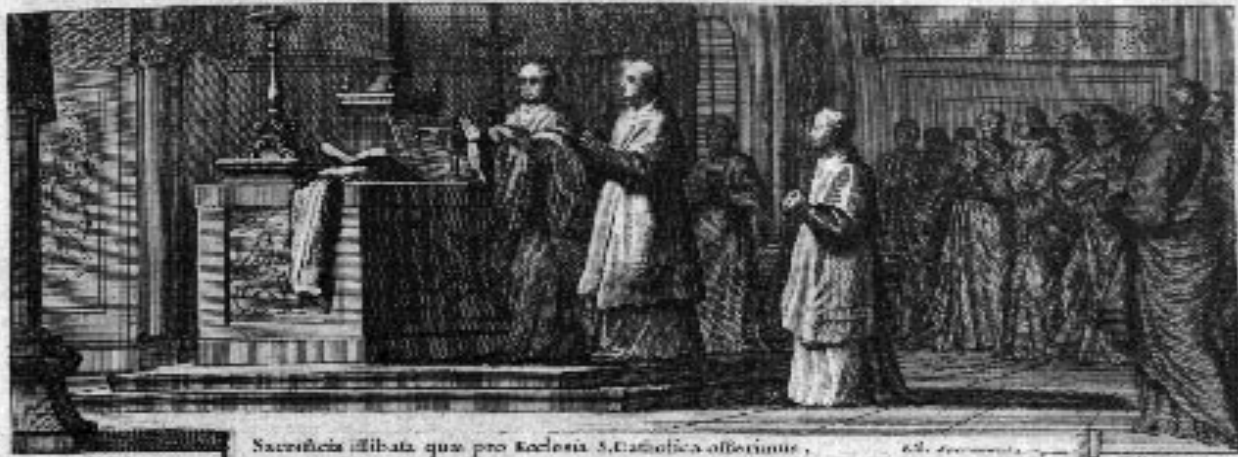
Sacrificia illibata quae pro Ecclesia S. Catholica offeruntur.