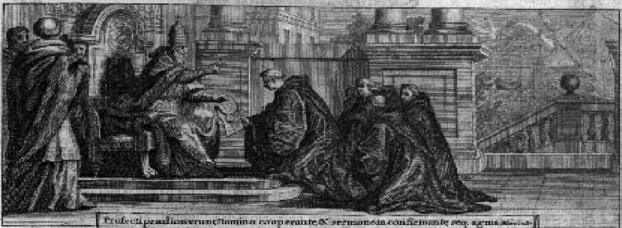
Profecti praedicationum flamina cooperante & sermone conficente seq. agmina...