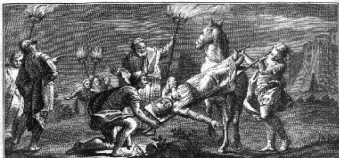
Joannes Chrysol. in caelum noctu deportatus, & modo deceditur.