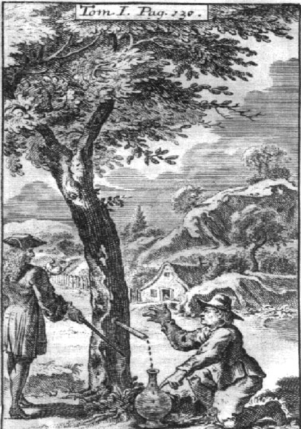
Arbre dont on tire la Sève